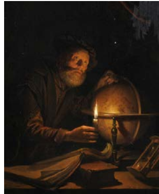
De astronoom , ca. 1650. Gerrit Dou. Museum De Lakenhal, Leiden

Om een schilderij echt te laten lijken, spelen kunstenaars vaak met licht en schaduw. Gerrit Dou doet dat ook in zijn schilderij De astronoom . Middenin het schilderij zet hij een kaars. Het is de enige lichtbron in de kamer. Hierdoor ontstaan er spannende schaduwen. Wat gebeurt er als jij jouw favoriete spulletjes op deze manier belicht?