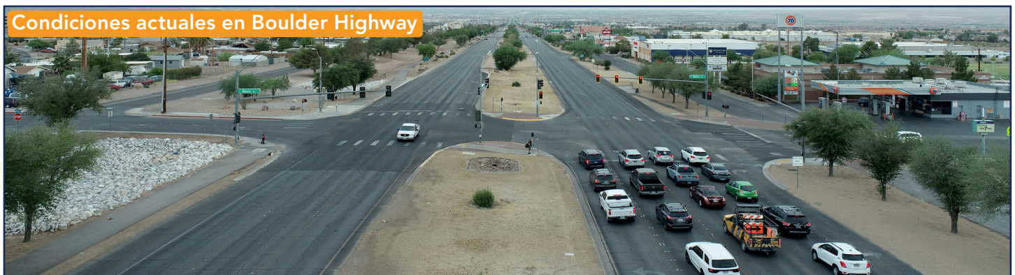
Condiciones actuales en Boulder Highway

A pesar de este cambio, el corredor de 15.4 millas sigue siendo un corredor de transporte crítico y la ciudad de Henderson lo identificó como una prioridad para las mejoras a fin de mejorar la seguridad y la movilidad a lo largo de la arteria