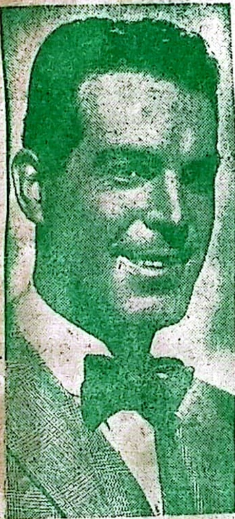
FRED Mac MURRAY