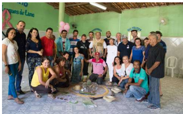
Encontro do Fórum em Palhano. 2017.

Neste espaço, organizações da sociedade civil se reúnem a cada dois meses, na segunda quinta-feira do mês, para discutir políticas públicas voltadas para a agricultura familiar camponesa, a juventude, o trabalho e a valorização das mulheres, a Educação Contextualizada, a Agroecologia, a Reforma Agrária, o acesso à água, a implementação de tecnologias sociais de convivência com o semiárido, dentre outras temáticas afins. Compõem este fórum os municípios de Alto Santo, Aracati, Beberibe, Ererê, Fortim, Iracema, Ibicuitinga, Icapuí, Itaiçaba, Jaguaratama, Jaguaribara, Jaguaruana, Jaguaribe, Limoeiro do Norte, Morada Nova, Palhano, Pereiro, Potiretama, Quixeré, Russas, São João do Jaguaribe e Tabuleiro do Norte.