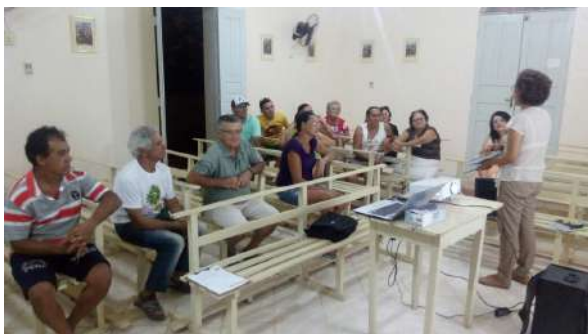
Reunião para discussão do Projeto Político Pedagógico da EFA, na capela da comunidade de Olho d'Água dos Currais