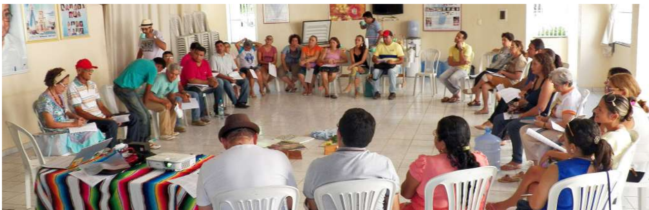
Primeira reunião de apresentação da proposta da EFA realizada no Salão Paroquial em Tabuleiro do Norte

No dia 1º de março de 2016, das 9 às 12hs, reuniram-se no salão paroquial um grupo de 30 pessoas com o objetivo de apreciarem a proposta de criação de uma Escola Família Agrícola em Tabuleiro do Norte. Eram agentes de pastoral da CPT, presidentes de associações comunitárias, sindicalistas, professores, técnicos agrícolas e universitários, religiosas, o pároco e diácono da paróquia e representantes da Cáritas Diocesana de Limoeiro, da Organização Barreira Amigos Solidários (OBAS), de Barreiras/CE e da CONTACTE, de Aracati/CE.