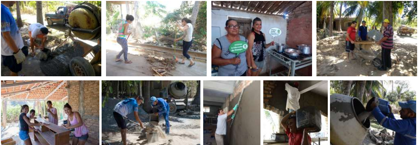
Algumas fotos nos mutirões realizados em 2017 e 2018

Tudo isso só foi possível após um longo processo de sensibilização e mobilização das pessoas e comunidades, apresentando o projeto da EFA, a sua importância para o processo de Convivência com o Semiárido, a necessidade de avançar na consolidação da Agroecologia. E deu certo! Muitas pessoas abraçaram o projeto e estão dedicando. Os desafios continuam aumentando. Os tempos não são fáceis. Mas onde há solidariedade e compromisso, o bem segue avançando e os bons projetos geram resultados impressionantes.