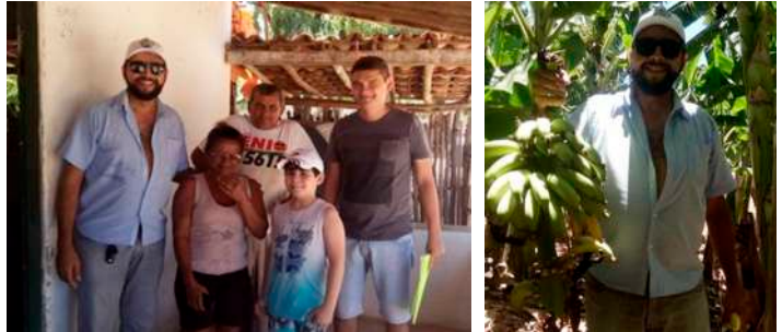
Visita ao PA Diamantina: 13 de outubro de 2017

A AEF AJA tem o compromisso de contribuir com a articulação das lutas sociais no campo e no fortalecimento das organizações camponesas. Nessa perspectiva, tem visitado assentamentos rurais, se reunido os presidentes das associações destes assentamentos e buscado encontrar formas de contribuir com suas lutas.