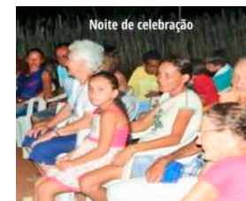
Visita ao terreno da EFA e aos moradores e moradoras dos Currais de Cima e Olho d'Água da Bica