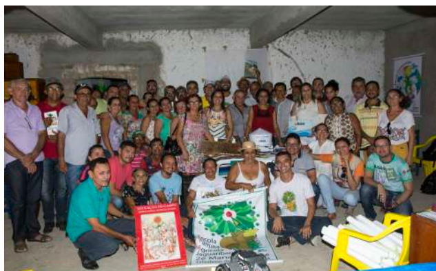
Encontro do Fórum em Tabuleiro do Norte. 2018.