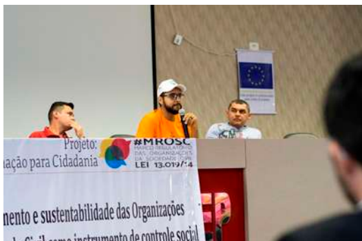
Seminário sobre o MROSC. Sede do Sindicato dos Servidores Públicos de Tabuleiro do Norte. 31/08/2017

Além de participar das audiências e outros momentos de debate, a AEFAJA contribuiu na apreciação à proposta de Decreto Municipal e compõe a equipe da sociedade civil de monitoramento da aplicação da Lei no município.