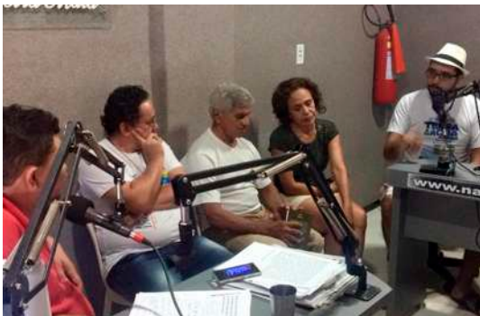
Participação na Comunitária Nativa FM

A AEF AJA esteve, em vários momentos, nas rádios comunitárias de Tabuleiro do Norte comunicando à sociedade suas atividades, o processo de implementação da EFA Jaguaribana e as campanhas de mobilização de recursos (humanos, financeiros e materiais). Sempre houve uma abertura das rádios para divulgar as ações da AEF AJA. Este é um dos veículos de comunicação mais importantes, principalmente porque consegue chegar a todas as comunidades do município de Tabuleiro do Norte. A presença nas rádios por diversas vezes foi fundamental para tornar a EFA Jaguaribana conhecida e mobilizar pessoas para a participação em diversas outras atividades da AEF AJA.