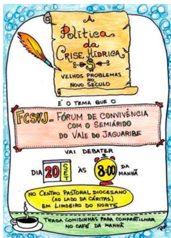
Um dos cartazes do Fórum

Um dos espaços privilegiados de composição e participação da AEAFAJ é o Fórum de Convivência com o Semiárido do Vale do Jaguaribe. O Fórum é uma articulação desta microrregião e faz parte do Fórum Cearense pela Vida no Semiárido (FCVSA), que por sua vez integra a Rede Articulação no Semiárido Brasileiro (ASA).