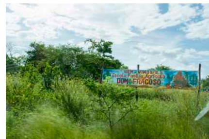
Visita a algumas das unidades produtivas da EFA Dom Fragoso - abril/2016

A EFA Dom Fragoso é mantida pela Associação Escola Família Agrícola de Independência – AEFAI. Suas atividades iniciaram no dia 1º de abril de 2002, com uma turma de 27 educandos(as), na 5ª série do Ensino Fundamental. A Proposta da EFA Dom Fragoso está baseada em quatro pilares: Associativismo, Alternância, Formação integral e Desenvolvimento Sustentável Local. Atualmente, mais de 20 jovens já são formados no Curso Técnico em Agropecuária na EFA Dom Fragoso.