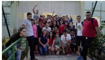
Comissão da EFA com Turma da UECE