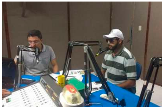
Participação na Caminhoneiro FM