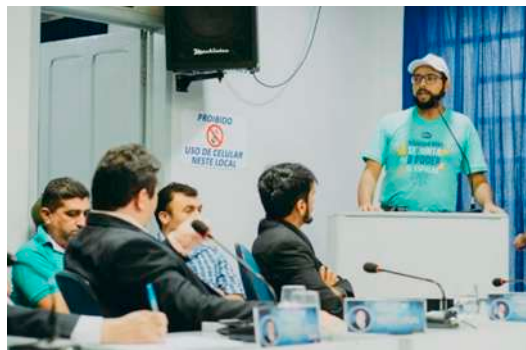
Audiência Pública para regulamentação do MROSC, realizada na Câmara Municipal de Tabuleiro do Norte. 01/11/2017