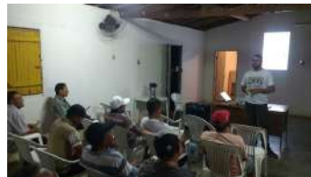
CINE EFA no Assentamento Donato - Tabuleiro do Norte