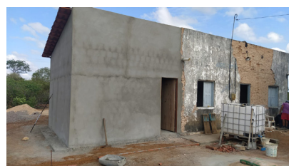
07/03/2022 Baixa do Juazeiro – Tabuleiro do Norte