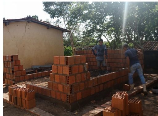
21/02/2022 – Barbatão – Palhano