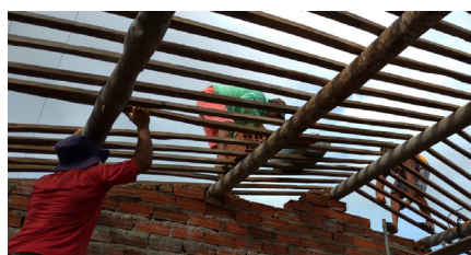
22/02/2022 Tapuí – Tabuleiro do Norte