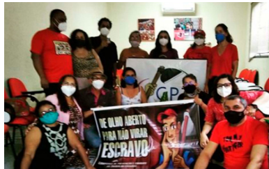
11/03/2022 - Fortaleza

No dia 11 de março de 2022 a AEFAJA participou da oficina de planejamento da Campanha de Olho Aberto para não virar Escravo, organizada pela Comissão Pastoral da Terra. Um dos objetivos da campanha é informar a população de como podem realizar denúncias de locais que possuem condições de trabalho análogas à escravidão. Nesse ano de 2022, a campanha faz 25 anos e a AEFAJA vem se somando para contribuir com essa luta!