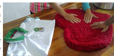
28/02/2022 - EFA Jaguaribana Tabuleiro do Norte

Em 28 de fevereiro, convocamos um encontro com o 3º ano da Escola Família Agrícola Jaguaribana Zé Maria do Tomé, nessa ocasião refletimos sobre Sociedade, Natureza e Agroecologia a partir da qualidade da nossa alimentação. O PVFC dessa turma pioneira, batizada de Turma Asa Branca, será um trabalho colaborativo e apresentará um projeto de ação com a escola e sua comunidade tendo em vista a causa maior da formação político pedagógica preconizada em seu ideário agroecológico.