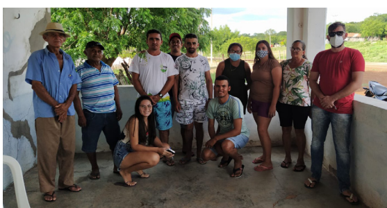
09/03/2022 - Assentamento Groenlândia Tabuleiro do Norte

A equipe Técnica do Projeto Sementes Crioulas/Tradicionais, Sustentabilidade e Agrofloresta reuniu-se, no dia 18/02, com a comunidade de Olho d'Água dos Currais, e no dia 09/03