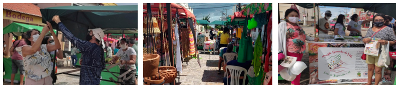
25/03/2022 - Aracati

No dia 25/03 a AEFAJA esteve presente junto com a Cooperativa Mista de Trabalho, Assessoria e Consultoria Técnico Educacional – CONTACTE na Feira Estadual Agroecológica e Solidária em Aracati. Organizada pela Cáritas junto com a Rede Bodega, esse foi o