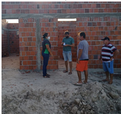
16/02/2022 – Camurim – Itaiçaba