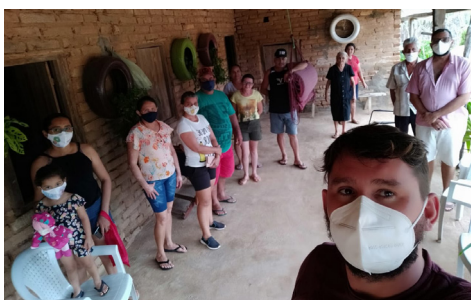
18/02/2022 - Comunidade Currais Tabuleiro do Norte