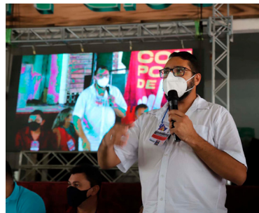
12/03/2022 - Associação Recreativa Tabuleirense (ART) Clube - Tabuleiro do Norte