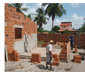
08/03/2022 Preá II - Fortim