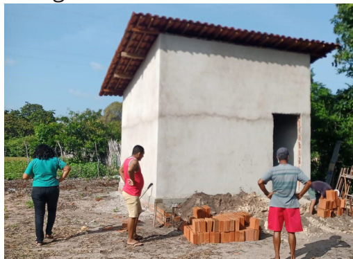
16/02/2022 – Volta Grande – Fortim

O Projeto Sementes da Vida no Vale do Jaguaribe é realizado pela AEF AJA em parceria com a CONTACTE, apoiadas pela Fundação Interamericana – IAF. Ao todo serão construídas ou retomadas 16 Casas de Sementes Comunitárias em 9 municípios do Vale do Jaguaribe. A seguir temos fotografias de algumas das casas em construção ou reforma (decisão das comunidades):