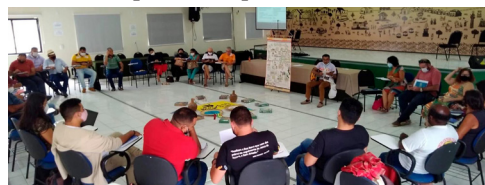
23/03/2022 - Fortaleza

A reunião ocorreu no dia 23/03, com objetivo de avaliar as ações do ano de 2021 e planejar o ano de 2022, dialogar sobre os desafios enfrentados no atual momento e discutir estratégias para a superação das dificuldades. É NO SEMIÁRIDO QUE A VIDA PULSA! É NO SEMIÁRIDO QUE O POVO RESISTE!