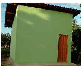
23/02/2022 Volta Grande - Fortim