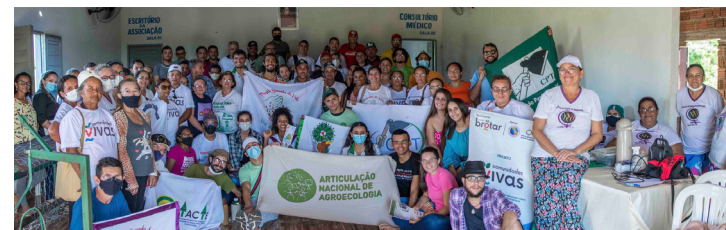
Intercâmbio no Assentamento Professor Maurício de Oliveira. Assú - RN. 18/05/2022

O Assentamento possui diversas experiências exitosas. Conhecemos o fogão ecológico, e também como é feito o biofertilizante a partir de urina e esterco bovino, utilizado no plantio do algodão em consórcio agroecológico. O plantio é feito junto com feijão, milho, maxixe, gergelim, melancia, jerimum e melão, em que uma planta ajuda a outra, recupera a fertilidade do solo, e diminui a incidência de ataques de insetos como o pulgão, o bicudo e formigas. Sem utilização de nenhum tipo de veneno. O Grupo de Mulheres Sementes da Terra também fabrica telas para cercamento.