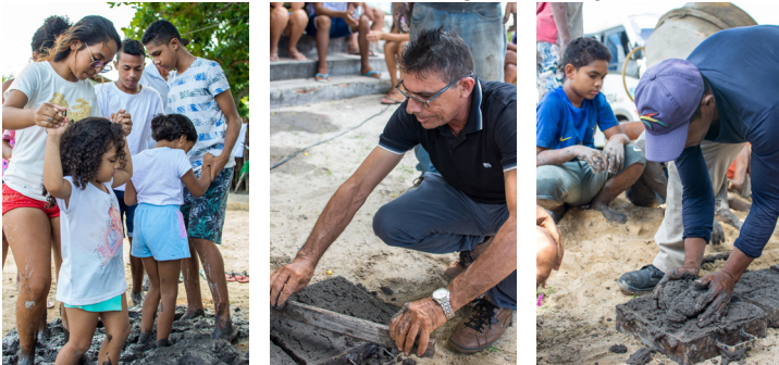
Amassando o barro e confeccionando tijolos. Quilombo Córrego de Ubaranas. Aracati - CE. 30/04/2022

Crianças, jovens e adultos ajudando em todas as etapas, desde a coleta do material, passando pela medição de quantidades e a amassada do barro, que precisa ficar bem homogêneo, até a colocação do material nas formas para fabricação dos tijolos.