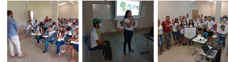
Semana do Chicão: Educação e Questões Ambientais. EEM Francisco Moreira Filho. Tabuleiro do Norte - CE. 04/05/2022

No dia 04/05, a AEFAJA participou da Semana do Chicão, realizada pela Escola Francisco Moreira Filho, debatendo sobre Educação e questões ambientais.