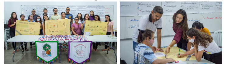
Vivência de Cartografia Social. IFCE - Campus Tabuleiro do Norte. 22/04/2022

Participaram representantes do Assentamento Groenlândia, Sítio Baixa do Juazeiro, Olho d'Água dos Currais, Tapuio, em Tabuleiro do Norte, e do Sítio Lima, no município de São João do Jaguaribe, bem como as organizações parceiras Cáritas Diocesana de Limoeiro do Norte, Instituto Brotar e Fundação de Educação e Defesa do Meio Ambiente do Jaguaribe – FEMAJE.