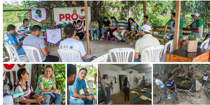
Representantes da empresa de algodão Vert-Veja em visita na AEFAJA e no distrito Bixopá - Limoeiro do Norte - CE. 02 e 03/05/2022

A AEFAJA vem conversando e trocando experiência com outras organizações que já têm projetos de produção e comercialização de algodão agroecológico na região, com objetivo de desenvolver projeto semelhante aqui no Vale do Jaguaribe.