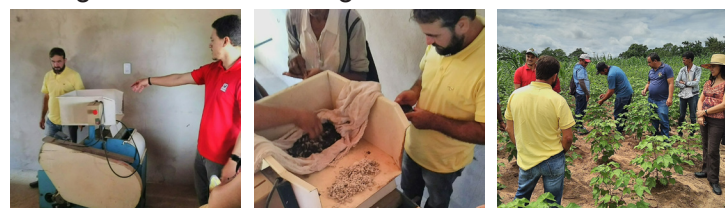
Unidade de descaroçamento e plantios agroecológicos de algodão. Assentamento Santa Maria. Quixadá - CE. 23/05/2022

Na oportunidade, conhecemos, no Assentamento Santa Maria, em Quixadá-CE, os plantios em consórcios agroecológicos de produção de alimentos e algodão, além da unidade de descaroçamento de algodão. O manejo agroecológico consorciado garante o equilíbrio e diminui a incidência de ataques de insetos como formigas e o bicudo do algodão.