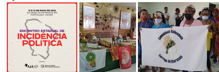
Encontro Estadual de Incidência Política. Centro Frei Humberto. Fortaleza - CE. 12 e 13/05/2022

Nos dias 12 e 13/05, a AEFAJA participou do Encontro Estadual de Incidência Política organizado pelo Fórum Cearense pela Vida no Semiárido - FCVSA, realizado no Centro de Formação, Capacitação e Pesquisa Frei Humberto, em Fortaleza -CE. Aconteceram debate de conjuntura e cenário eleitoral de 2022, partilha e construção de caminhos para incidência no Ceará, apontamentos sobre as Políticas Públicas para Agricultura Familiar e Convivência com Semiárido, trabalhos e grupos e plenária de socialização e prioridade de ações. AAEFAJA também contribuiu com a relatoria do evento.