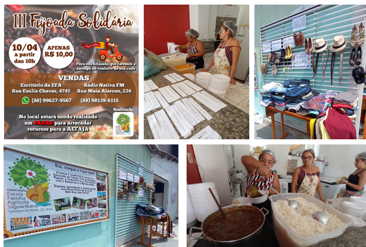
III Feijoada e Bazar Solidários. Tabuleiro do Norte - CE. 10/04/2022

A AEF AJA realizou a III Feijoada e Bazar Solidários no dia 10/04. Agradecemos a todas e todos que puderam contribuir com a Associação. Os bazares e feijoadas solidárias são importantes ações de mobilização de recursos para continuidade dos nossos trabalhos.