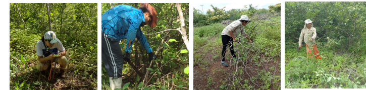
Manejo da agrofloresta da EFA Jaguaribana. Currais de Cima. Tabuleiro do Norte - CE. 10/05/2022

A implantação da agrofloresta da EFA é uma ação dos projetos: "Sementes da Vida no Vale do Jaguaribe", apoiado pela Fundação Interamericana - IAF; "Sementes Crioulas/Tradicionais, Agrofloresta e Sustentabilidade Ambiental no Semiárido", apoiado pela Embaixada da Suíça no Brasil e "Quintais de Saberes e Sabores do Semiárido", apoiado pelo Instituto Irmãs da Santa Cruz.