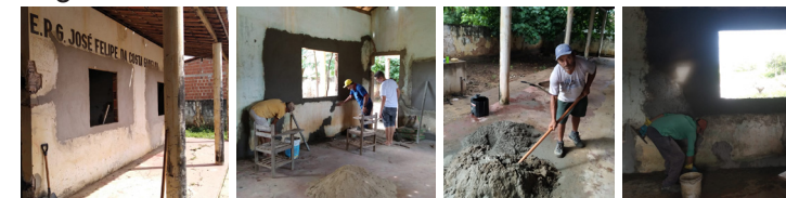
Mutirão de reforma nos dias 15 e 21/05/2022. Escola José Felipe da Costa Gadelha. Currais. Tabuleiro do Norte - CE.

A Escola José Felipe da Costa Gadelha, da Comunidade Olho d'Água dos Currais, está sendo reformada para funcionar o Centro de Formação, um espaço que será utilizado para aulas de informática para jovens e adultos do projeto "Fortalecendo a Educação do Campo através da inclusão digital", realizado pela AEFAJA com apoio da Fundação Banco do Brasil. Além disso, servirá também como laboratório de informática para as turmas da Escola Família Agrícola (EFA) Jaguaribana Zé Maria do Tomé e outras atividades.