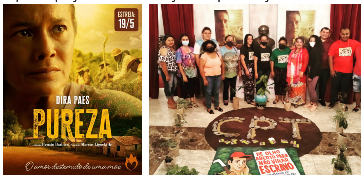
Pré-lançamento social filme Pureza Sobral - CE

Convidamos todas e todos a assistirem ao filme Pureza e a se engajarem na luta contra o trabalho escravo. Além disso, agradecemos a CPT por garantir a participação da Associação no pré-lançamento.