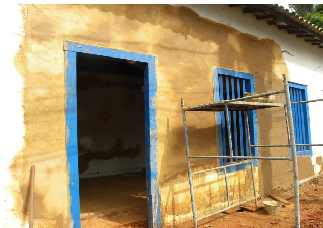
Parede de pau a pique acabada