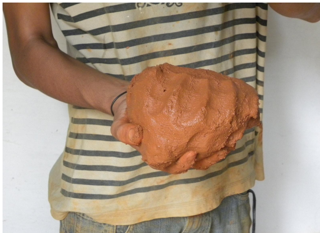
Marca das mãos na bolota de barro