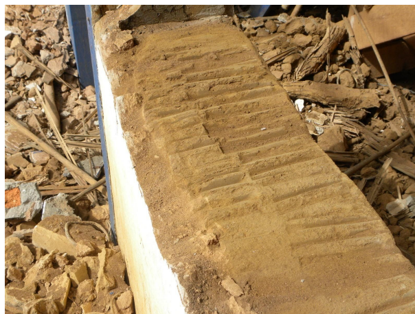
Peitoril de taipa de pilão com a marca original do apiloamento