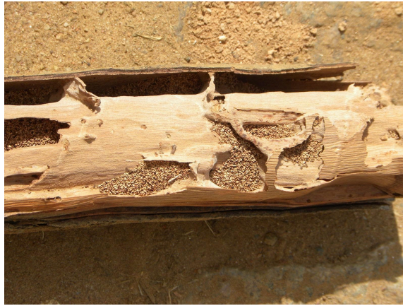
Focos de cupins nos esteios