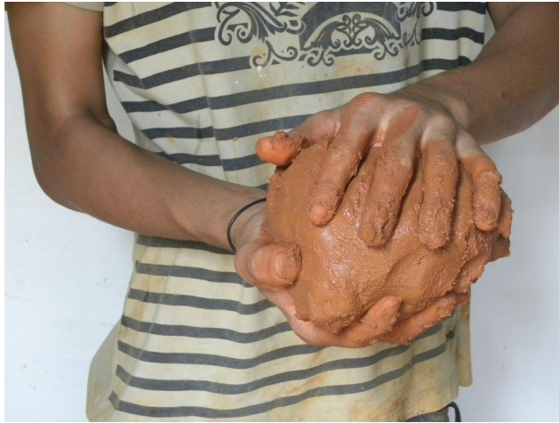
Consistência plástica do barro para o preenchimento