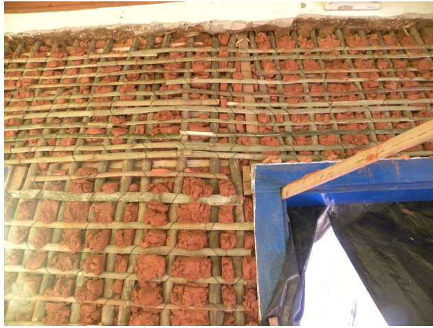
Vista interna do primeiro barreado