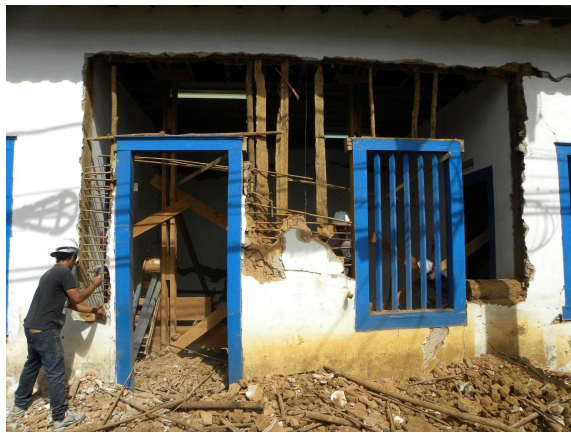
Demolição do pau a pique