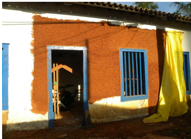
Primeira demão seca pronta para o acabamento