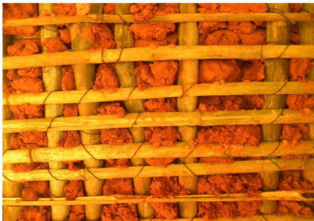
Primeiro barreado para preenchimento da trama