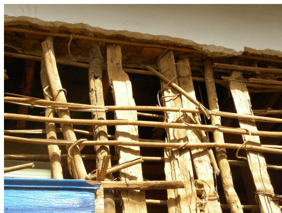
O estado da trama original