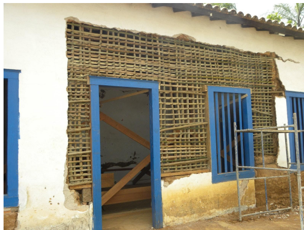
Estrutura pronta para o primeiro barreado