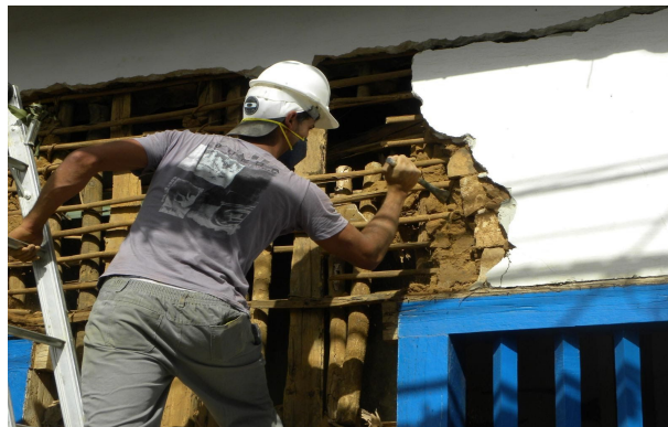
Retirada da terra para análise da trama de madeira