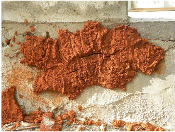
Ensaio de aderência do barro