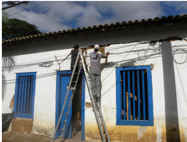
Marca do descolamento da parede com a percinta – dez.2013