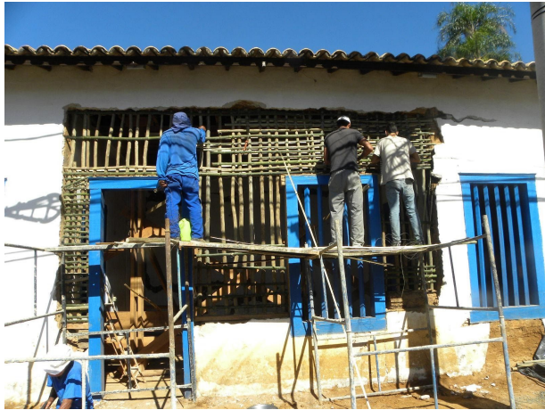
Montagem da nova trama de eucaliptos e bambu