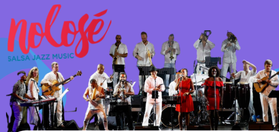
nolosé SALSA JAZZ MUSIC