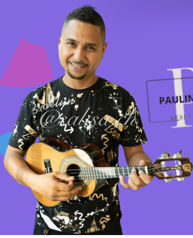
PS PAULINHO SANTOS RESISTÊNCIA DE BÉLO OZÓ