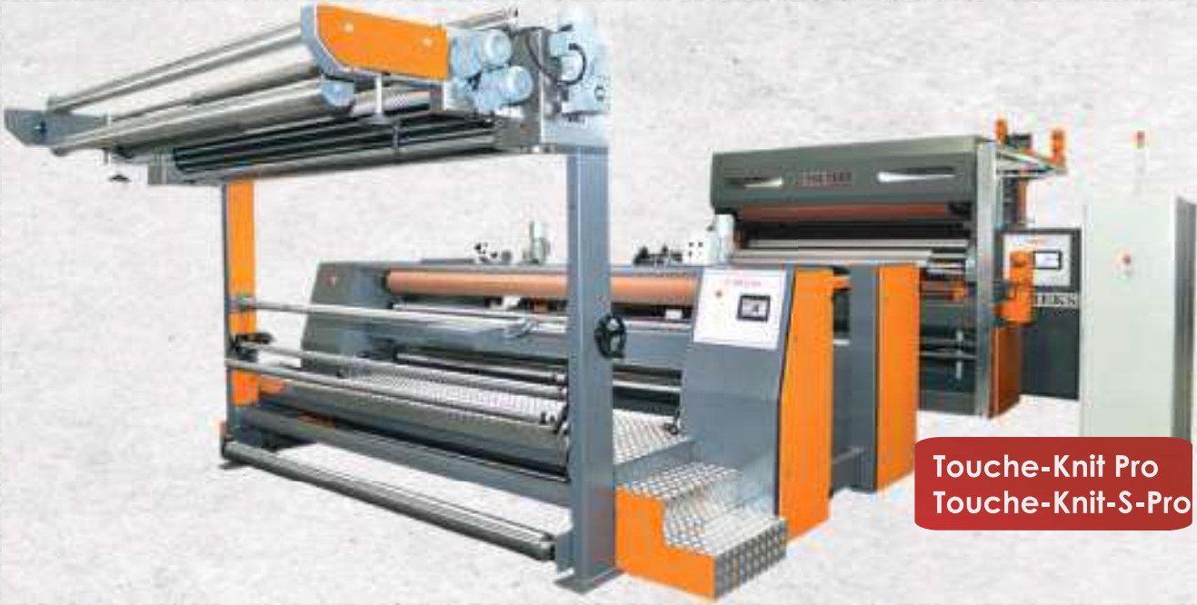
Touche-Knit Pro Touche-Knit-S-Pro

Sektörel ihtiyaçlar doğrutusunda tasarlanmış bu makina ile çekmezlik, boy sabitleme ve tuşe ayarlanmasında örme kumaş grubu için yeni bir seçenek oluşturmaktadır. Kompaktör ve kalender birleşimi olan makinamız; sektörde farklılıklar yaratmanıza yardımcı olması adına tasarlanmıştır. Özel teknoloğimiz olan blanketli kalenderleme ünitesi ile eşsiz tuşe almanızı sağlar.