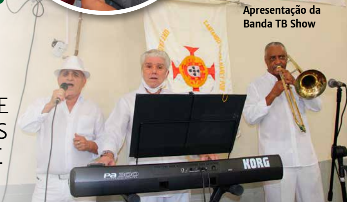
Apresentação da Banda TB Show

DE FUNDAÇÃO E CHAMA AMIGOS E COMUNIDADE PARA FESTEJAR