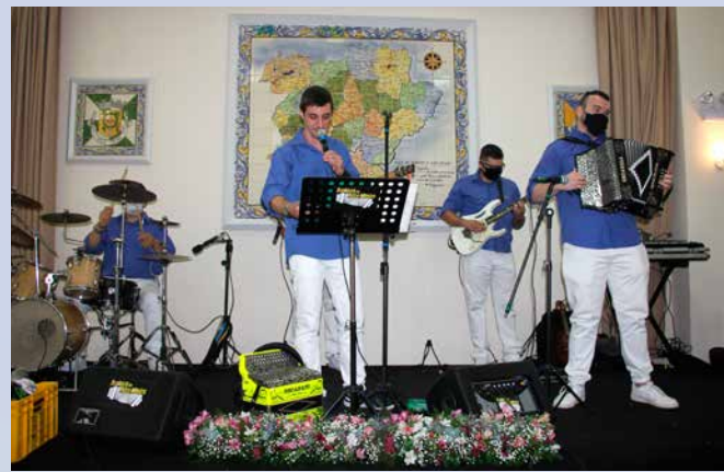
Amigos do Alto Minho animaram a tarde no almoço de aniversário da casa de Trás-os-Montes e Alto Douro