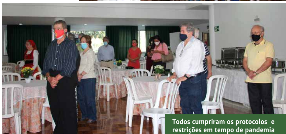
Todos cumpriram os protocolos e restrições em tempo de pandemia

A comemoração da padroeira da Casa do Minho transcorreu com alegria e devoção, apesar dos cuidados com a pandemia e das restrições que todas as casas portuguesas do Rio de Janeiro sugerem a seus amigos, associados e frequentadores.