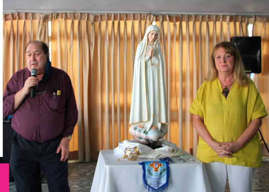
Os presidentes e a marca do Clube Português de Niterói