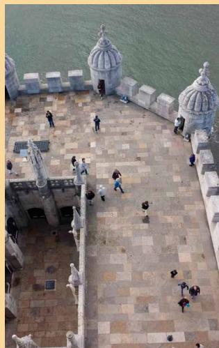
Topo da Torre de Belém – Lisboa