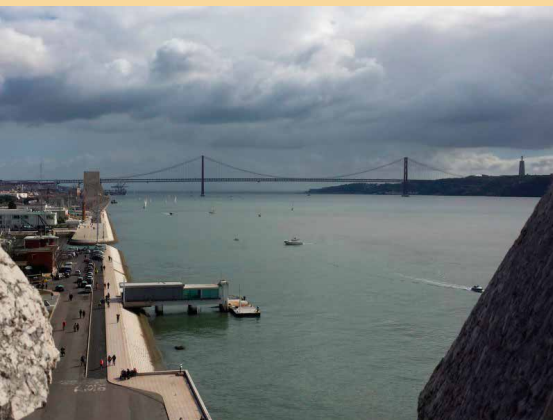
Panorâmica do Tejo e a ponte 25 de Abril – Lisboa