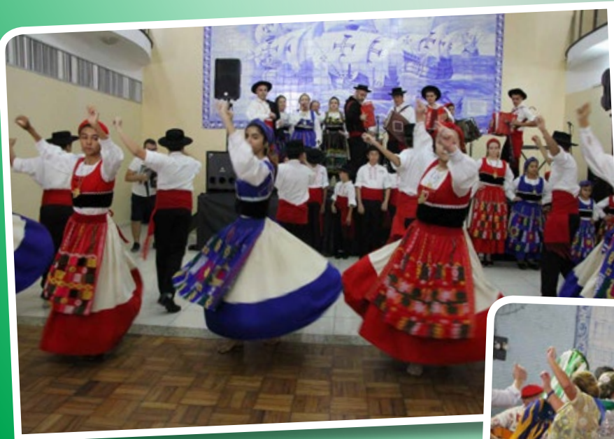
Juvenil da Casa do Minho em aniversário (34 anos)