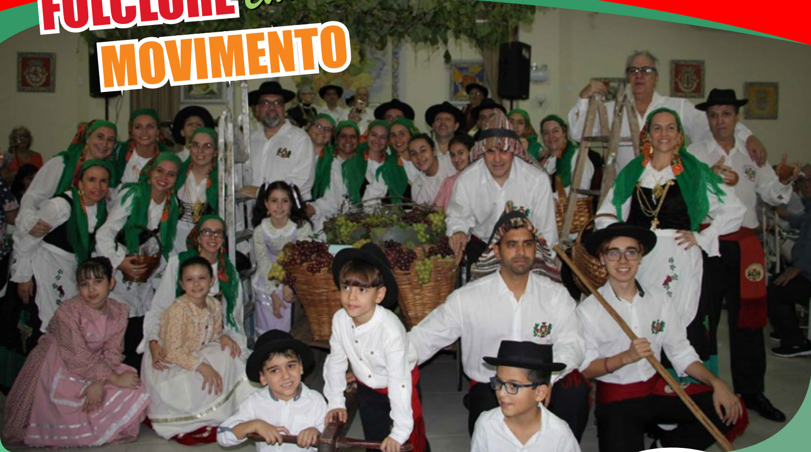
GUERRA JUNQUEIRO. Casa de Trás-os-Montes