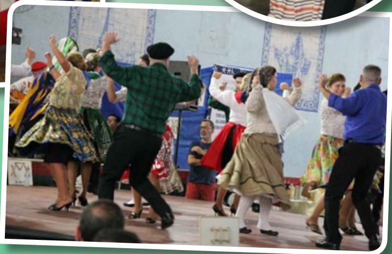
Rancho Poveiro, de Póvoa de Varzim