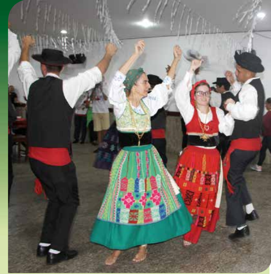
O Rancho Folclórico Luis de Camões e o show