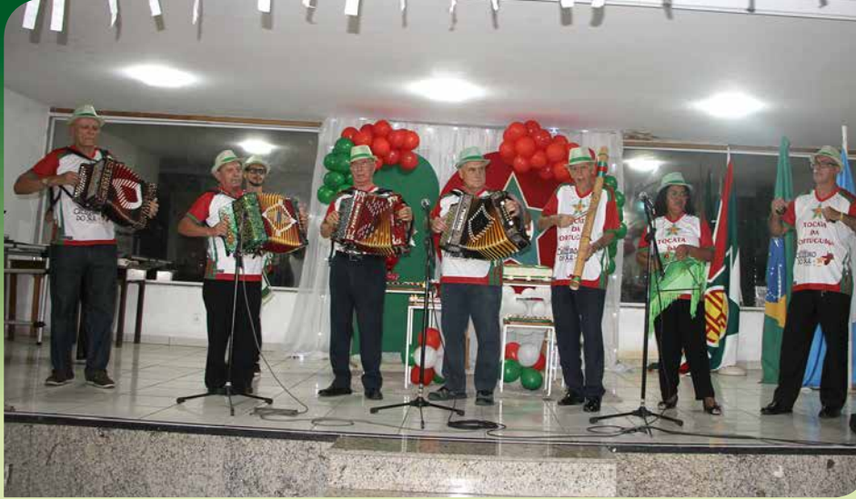
Em ação, a Tocata da Portuguesa