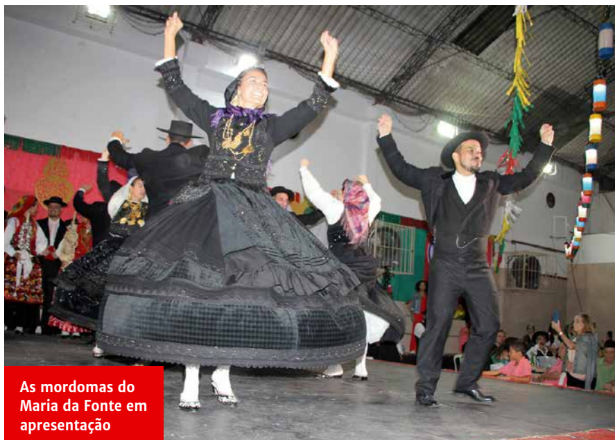
As mordomas do Maria da Fonte em apresentação