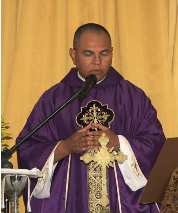
A missa e o padre