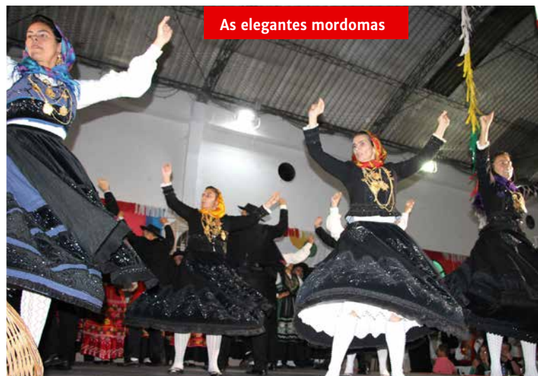
As elegantes mordomas