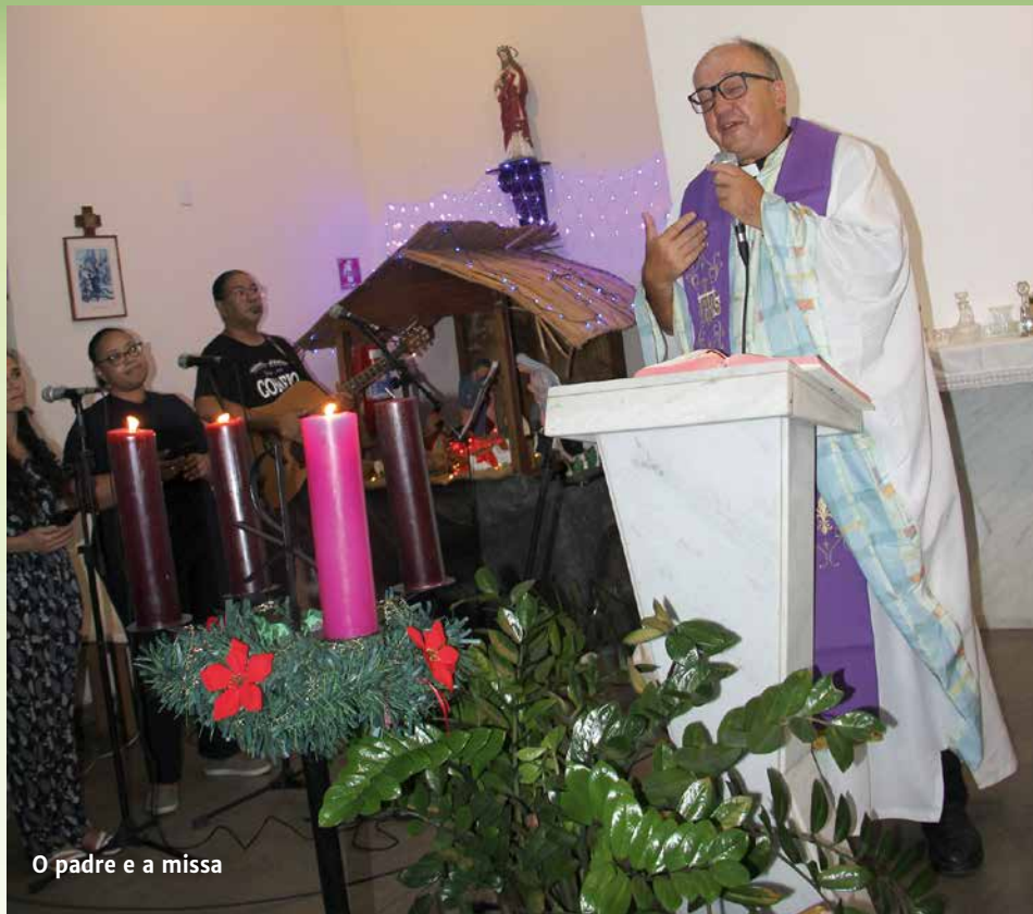
O padre e a missa

A Associação Atlética Portuguesa completou no domingo, dia 17 de dezembro, 99 anos de fundação. O clube, que se notabiliza como um dos mais tradicionais da região, que dá nome a um dos principais bairros da Ilha do Governador, chega às vésperas do seu centenário com muitos motivos para comemorar após mais um ano de vida com grandes evoluções e notícias boas para os associados e torcedores do clube.