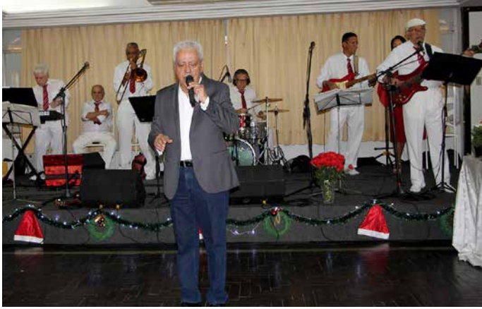
O cantor brilha com a orquestra TB Show