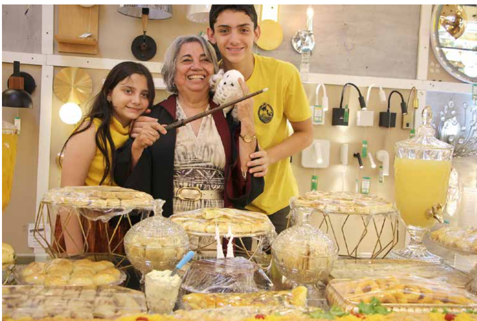
Com os netos, muita alegria!