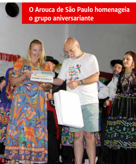
O Arouca de São Paulo homenageia o grupo aniversariante