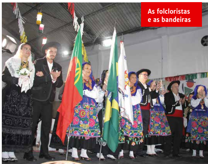
As folcloristas e as bandeiras

A noite começou com a apresentação marcante da Tocata dos Amigos e do Maria da Fonte, que encantou a todos e ressoou no ambiente, fazendo história e preparando o público para uma noite de celebração, tradição e cultura portuguesa. Este grupo, composto por talentosos dançarinos, cantadeiras, cantadores e músicos, contou com a participação especial de folcloristas de Ranchos de diferentes regiões do Brasil,