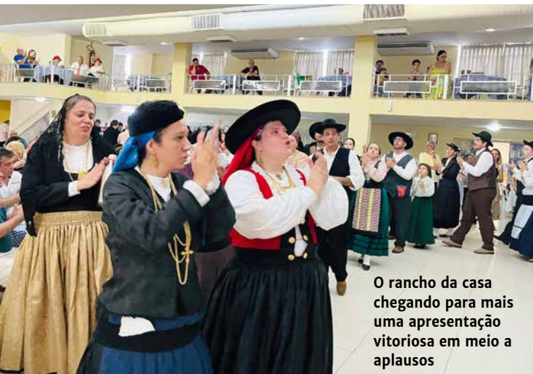
O rancho da casa chegando para mais uma apresentação vitoriosa em meio a aplausos