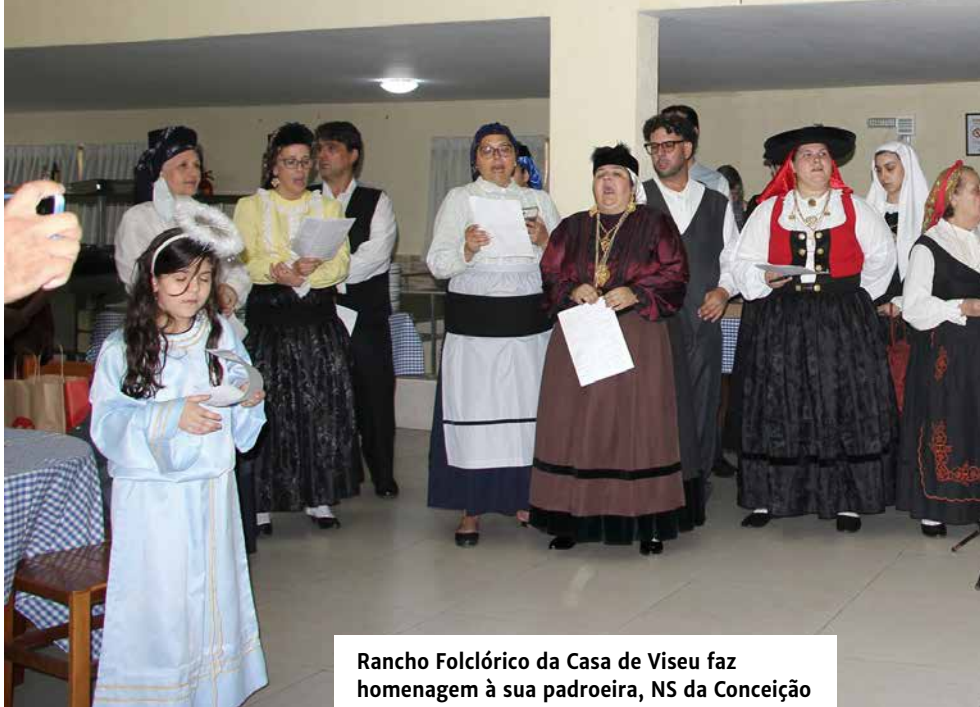
Rancho Folclórico da Casa de Viseu faz homenagem à sua padroeira, NS da Conceição