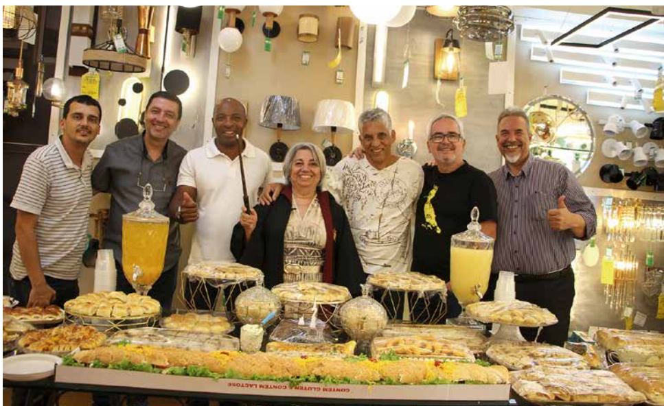
Com representantes, todos amigos e admiradores