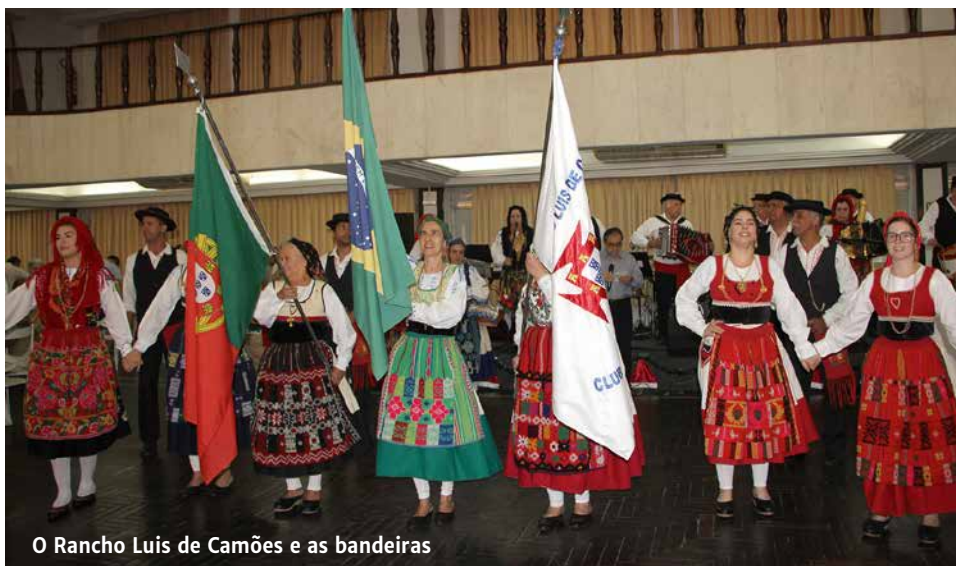
O Rancho Luis de Camões e as bandeiras

nhado pela competente Banda TB Show e tirou do baú alguns de seus grandes sucessos, como Verde Vinho e Vinte e Quatro Rosas. De parabéns, como sempre, o Clube Português de Niterói e sua diretoria, que celebra a cada oportunidade os valores mais ricos e tradicionais de Portugal.