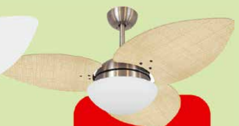
VOLARE_BRONZE VD42_DUNA MIS_S_PALMAE_NT