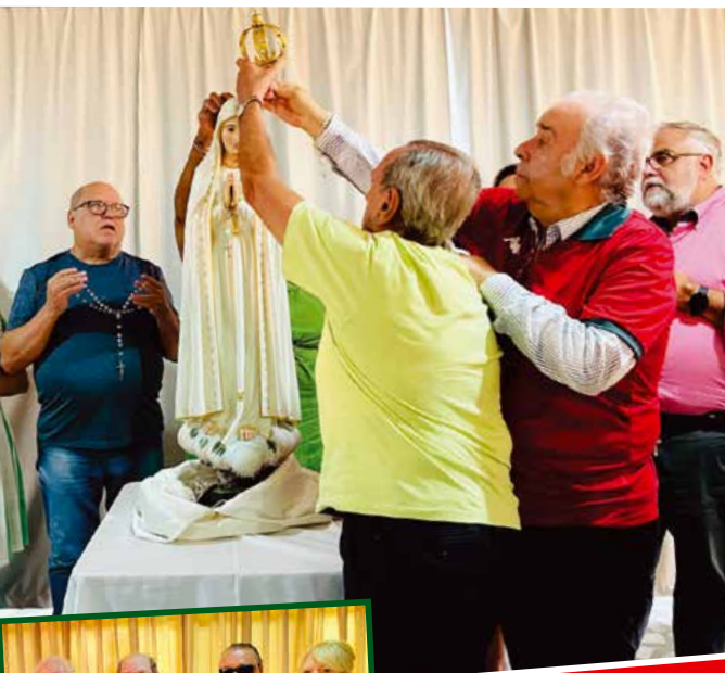
Encontro com a Padroeira renova a alegria no Clube Português de Niterói