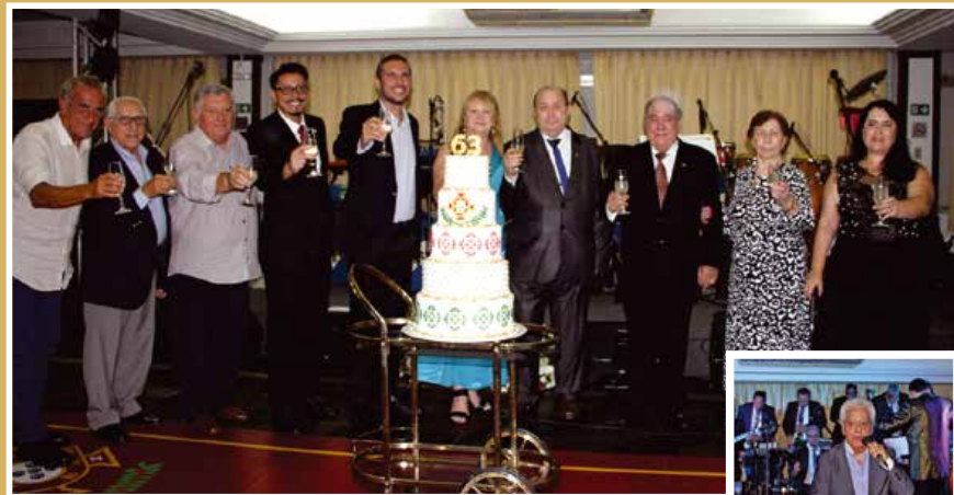
Clube Português de Niterói faz 63 anos em ritmo de tradição e alegria