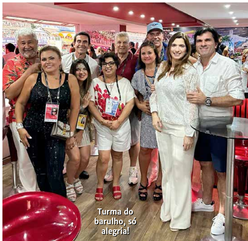
Turma do barulho, só alegria!