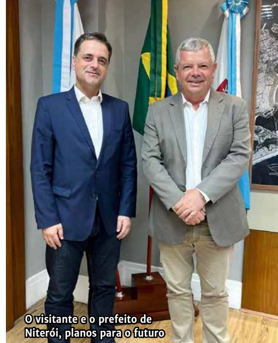
O visitante e o prefeito de Niterói, planos para o futuro