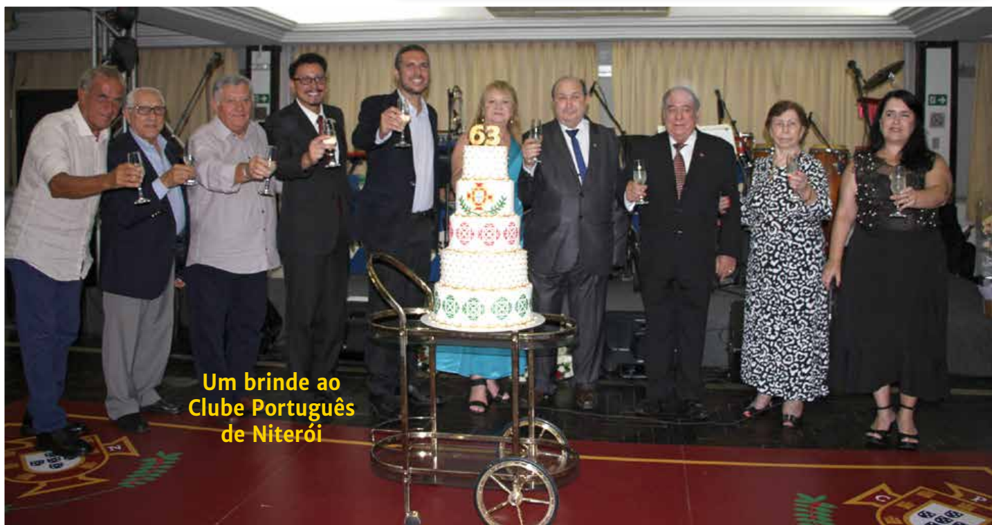
Um brinde ao Clube Português de Niterói