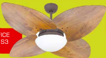
VL CB OFFICE DUNAMIS S3 RADICA IB