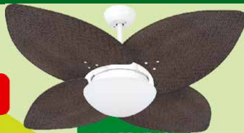
VL BF VD42 DUNAMIS PALMAE TB