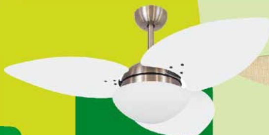
VL BZ VD42 DUNAMIS S3 BR