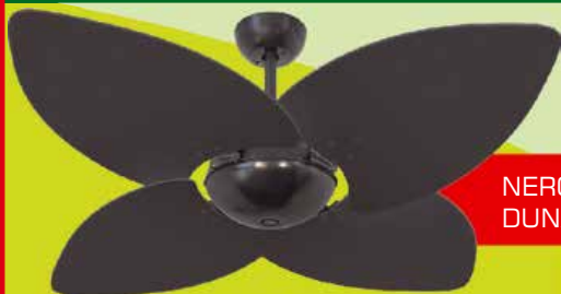
NERO OFFICE DUNAMIS PT

Produtos diferenciados, que mesclam tecnologia, design e qualidade, aliados a um atendimento especializado e fornecedores exclusivos, fazem da BENFICA ILUMINAÇÃO uma referência.