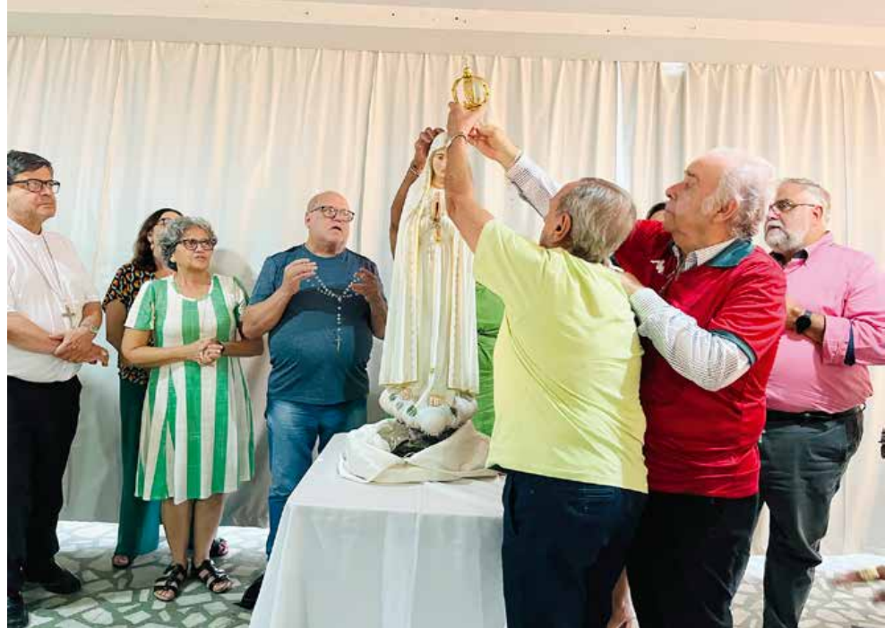
Momento de grande emoção quando a imagem da santa é coroada