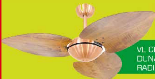
VL CB OFFICE DUNAMIS S3 RADICA IB

Rua Senador Bernardo Monteiro, 62 - Benfica - Rio de Janeiro - RJ