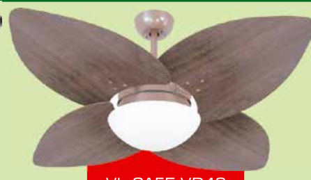
VL CAFE VD42 DUNAMIS TB