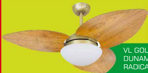
VL GOLD VD42 DUNAMIS S3 RADICA FJ