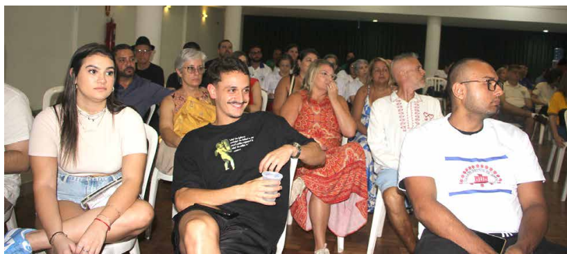
O salão da Casa do Minho, lotado