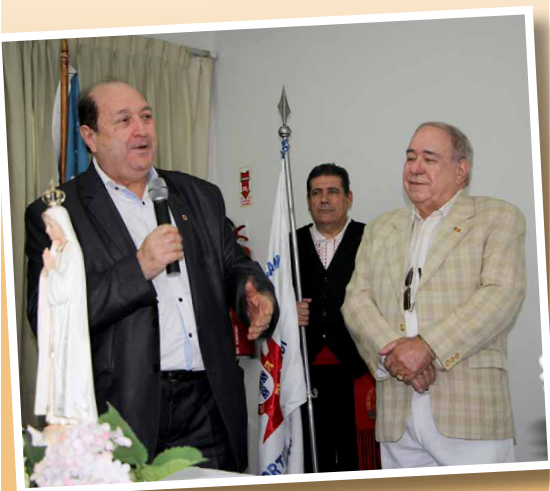
O vice-presidente fala sobre o papel social do Clube