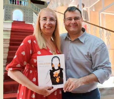
Presidente da Casa do Minho e o autor