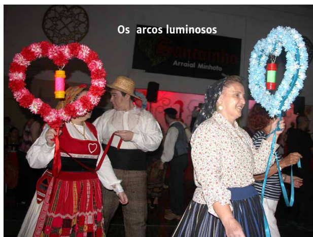
Os arcos luminosos