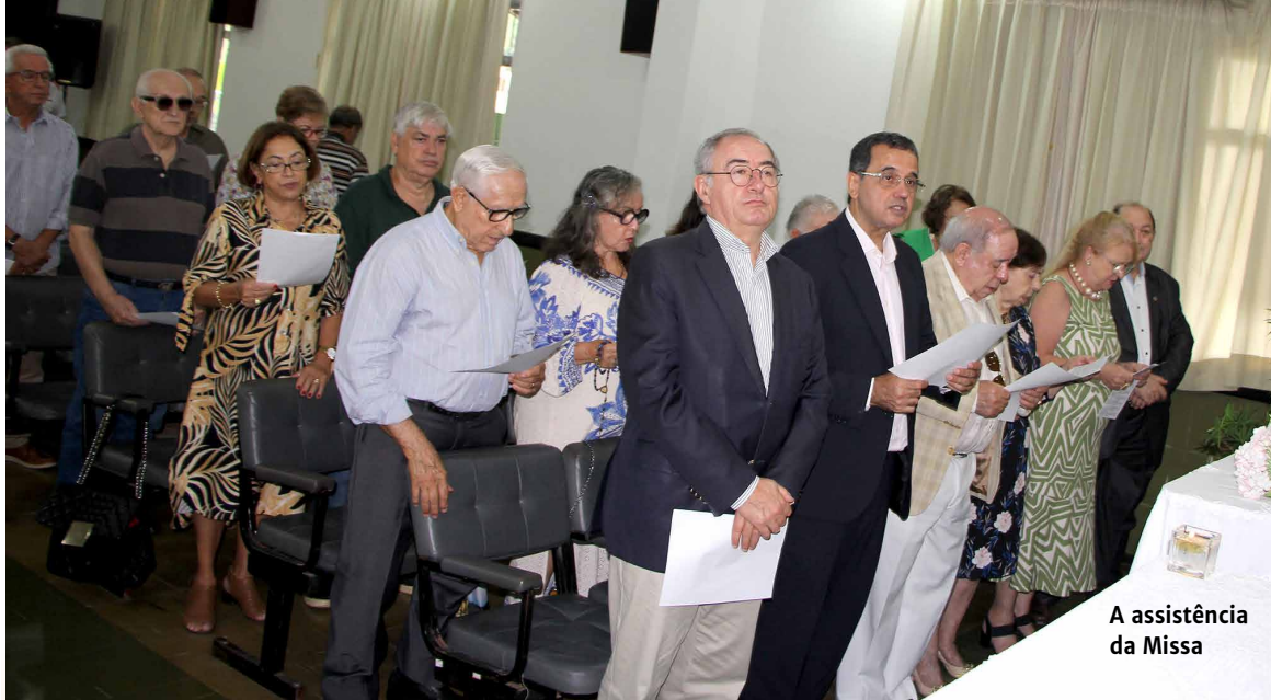
A assistência da Missa