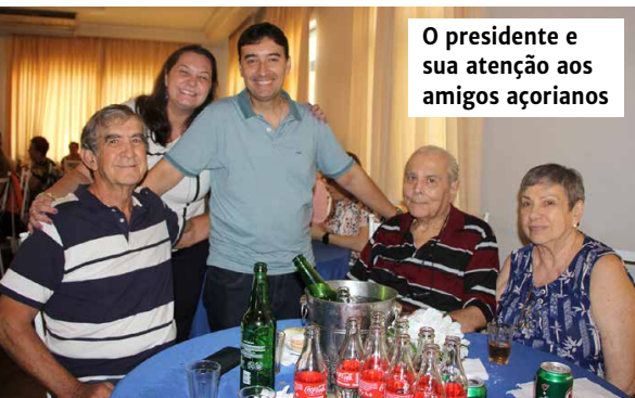
O presidente e sua atenção aos amigos açorianos