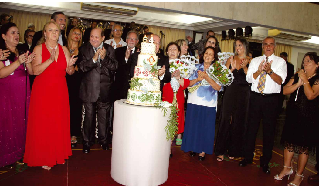
Clube Português de Niterói faz 64 anos de alegria, sucesso e tradição