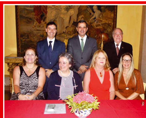
Tomam posse os novos Conselheiros da Comunidade no Palácio São Clemente

Eleições legislativas em Portugal dá vitória à coligação Aliança Democrática, do PSD