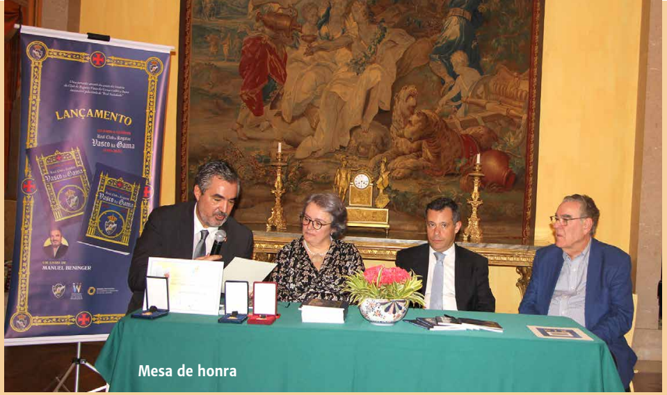
Mesa de honra