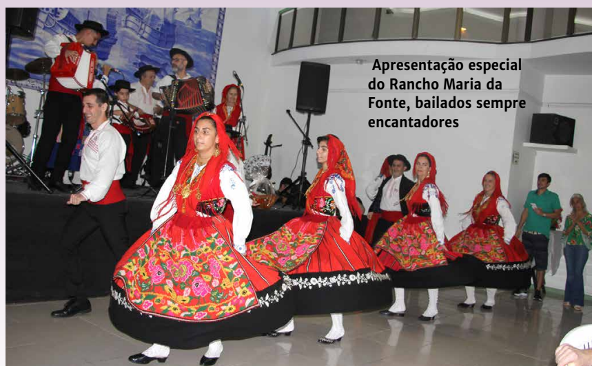
Apresentação especial do Rancho Maria da Fonte, bailados sempre encantadores