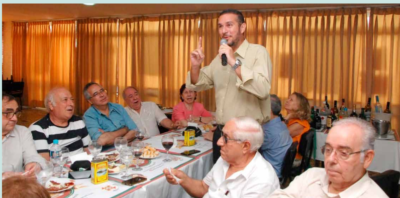
O presidente do Clube Central e da Associação dos Clubes de Niterói, fala do amigo aniversariante