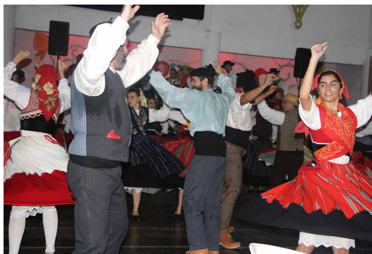
Brilhante atuação do Maria da Fonte

Muita gente, muitos amigos, todos compareceram para a primeira Festa de Santoinho de 2024. Houve degustação de sardinhas na brasa, batatas cozidas e muitas outras iguarias. Além dessas atrações, danças e cantares daquela região portuguesa, o que emocionou, deveras, alegres convidados para o espetáculo. A Casa do Minho já reúne atrações para um