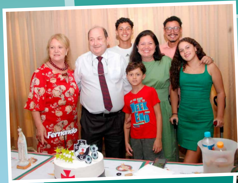
A família Guedes, homenageada também