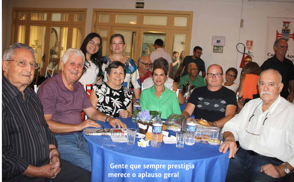
Gente que sempre prestigia merece o aplauso geral