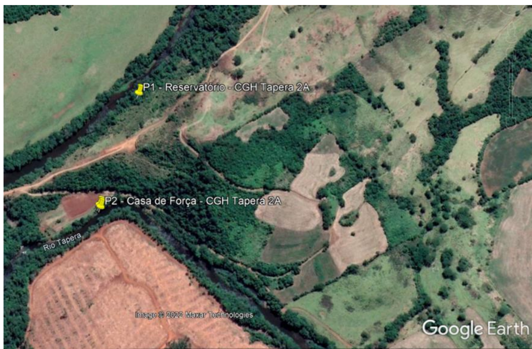
Figura 2 - Pontos de coleta de água na CGH Tapera 2A.

A seguir são apresentados os pontos amostrais escolhidos.