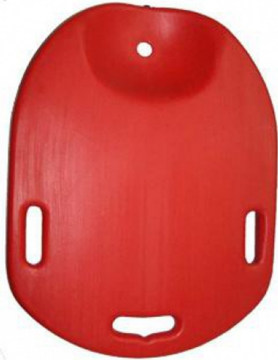
TABLA PARA RCP PLÁSTICA