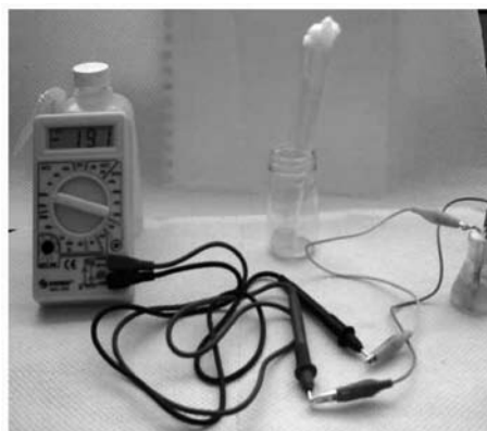
Figura 2: Monitoreo de potencial de los microsensores con multímetro sencillo

en el medio. La selectividad del microsensador no requiere un tratamiento previo de la muestra ya que no es necesario separar biomasa, proteínas, etc.