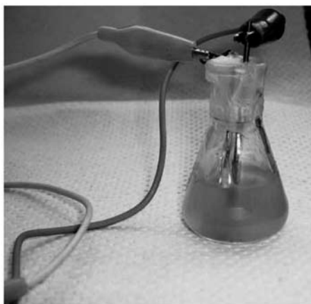
Figura 1: Microcultivo y los microsensores de bajo costo construidos en el laboratorio: microelectrodo indicador de plata-sulfuro de plata y microreferencia de cobre.

La Figura 1 muestra el microcultivo y los microsensores de bajo costo construidos en el laboratorio. Se muestra la utilidad de la miniaturización de los electrodos y el cultivo para ahorro de reactivos, materiales y tiempos de operación.