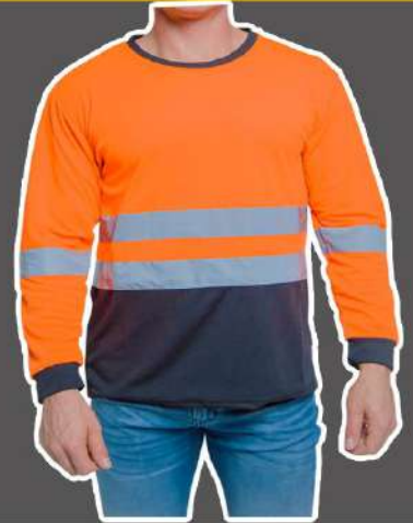
PLAYERA MANGA LARGA