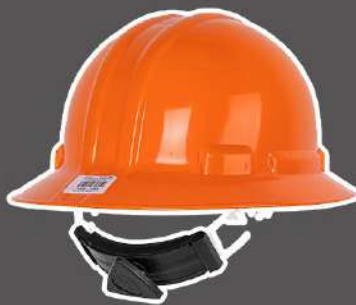
CASCOS DE SEGURIDAD