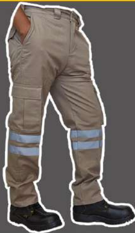
PANTALÓN DE GABARDINA