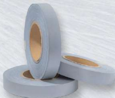
GRIS 1", 1 1/2", 2"