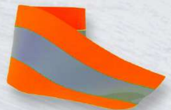
NARANJA NEÓN 2"