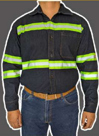
CAMISOLA DE MEZCLILLA