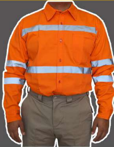
CAMISOLA DE GABARDINA