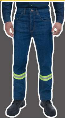
PANTALÓN DE MEZCLILLA