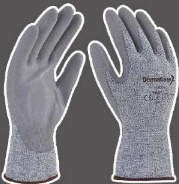
GUANTES DE PROTECCION