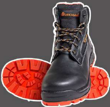
CALZADO DE SEGURIDAD