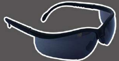
GAFAS DE SEGURIDAD