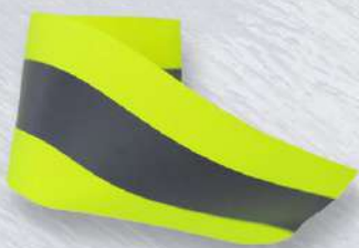
AMARILLO NEÓN 2"