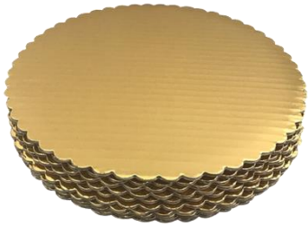
Bases para pastel