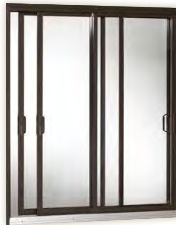
Porte couleur brun commercial