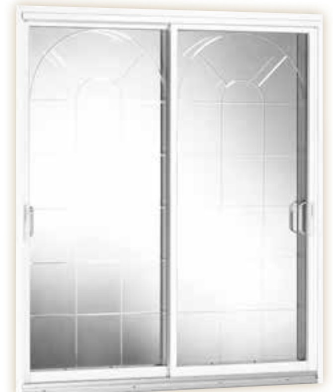
Verre rainuré/énergétique avec gaz argon