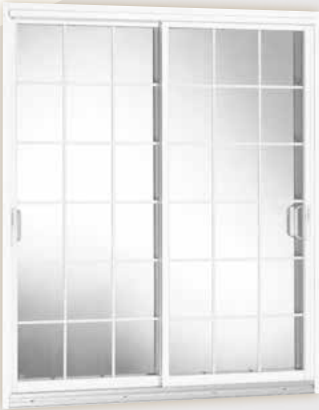
Porte blanche avec carrelage standard rectangulaire blanc