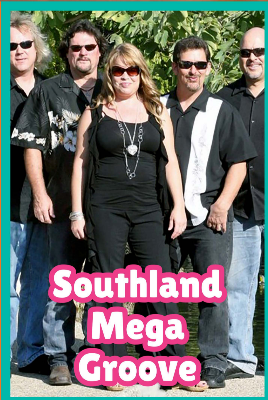
Southland Mega Groove