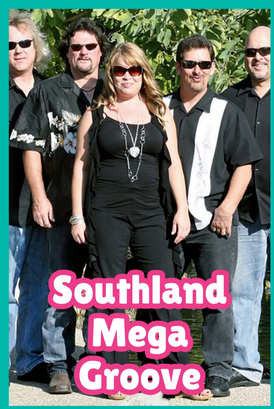
Southland Mega Groove