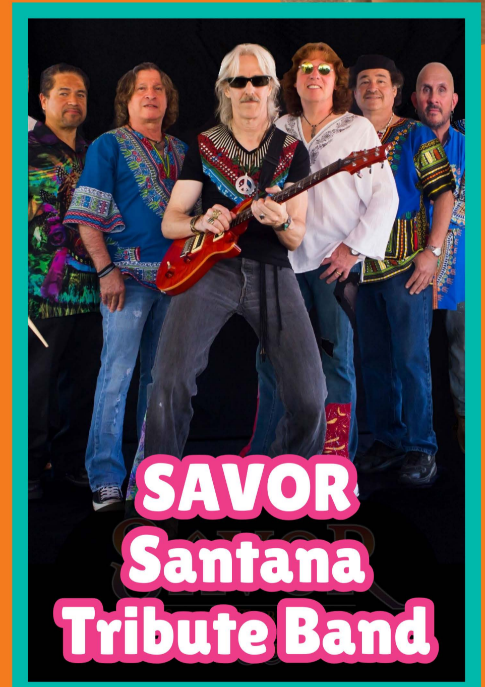
SAVOR Santana Tribute Band