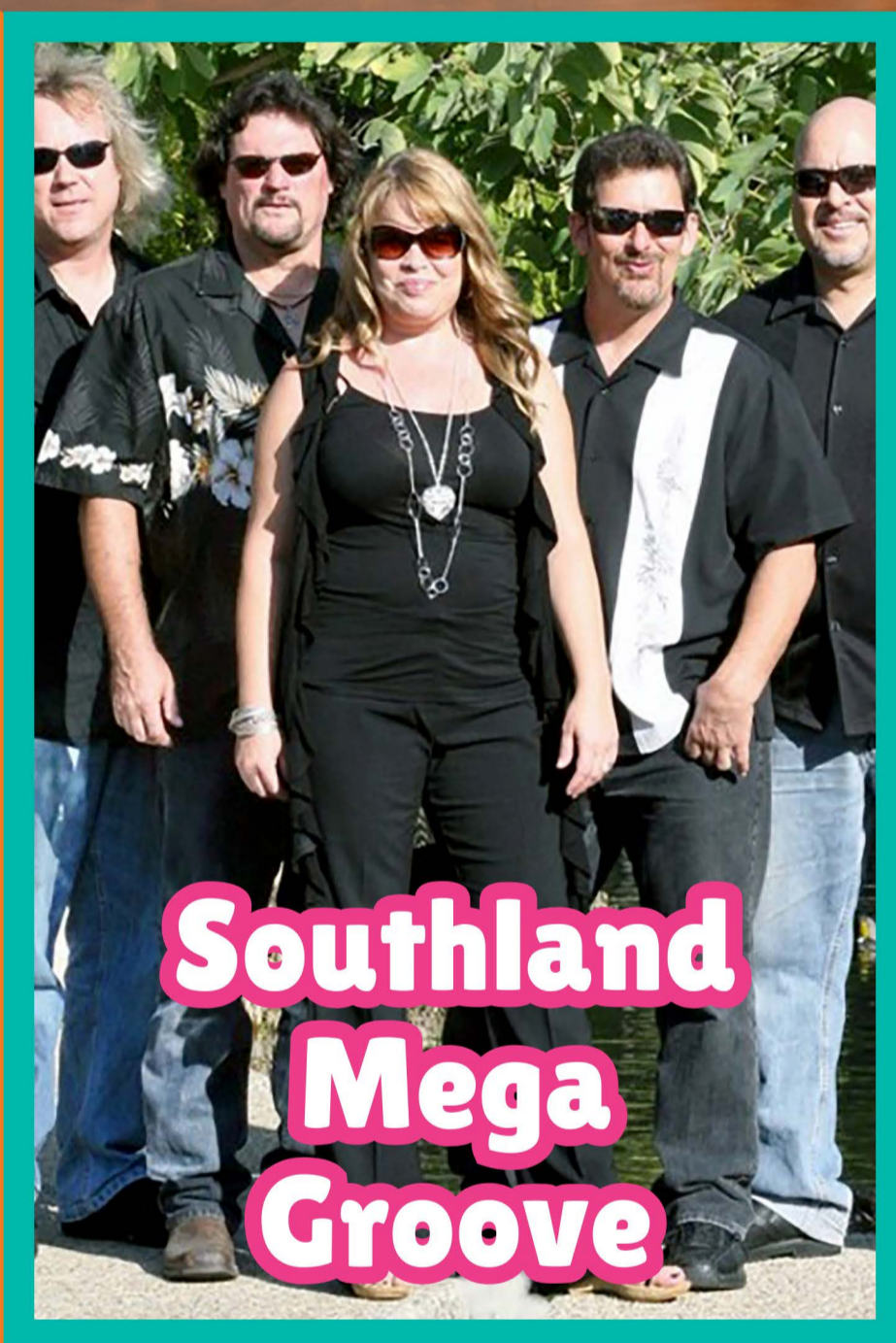
Southland Mega Groove