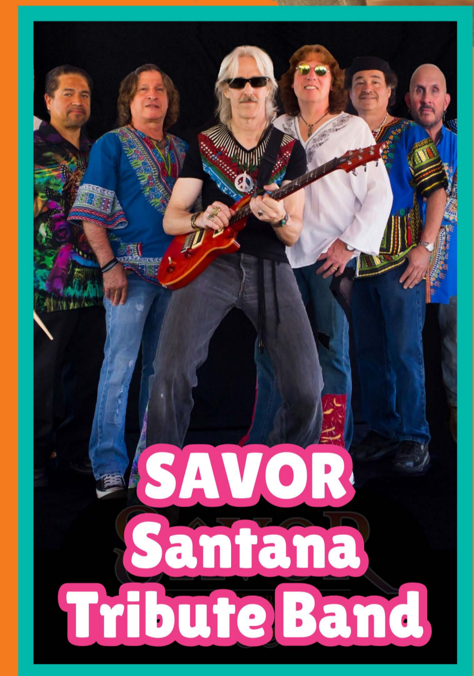
SAVOR Santana Tribute Band