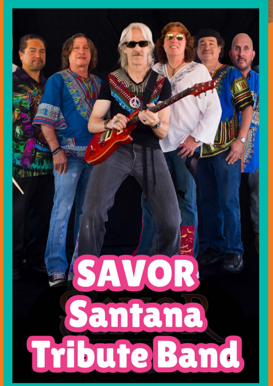
SAVOR Santana Tribute Band