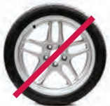
Llantas y refacciones de auto