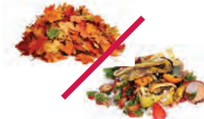
Desechos de jardín y de comida