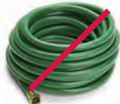
Mangueras de jardín