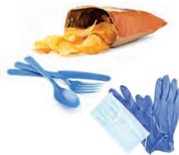
Plásticos no reciclables