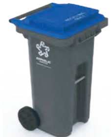
35 galones 36" H x 19.7" W x 26.3" D Cabén tres bolsas de basura de 13 galones

H=Altura W=Ancho D=Profundo (El color del contenedor que se muestra es solo para reciclaje.)