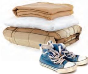
Ropa y cubiertas de cama