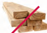
Desechos de construcción