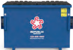
Contenedor de 3-yardas (80" L x 42" W x 46" H)