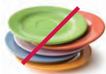
Platos y espejos