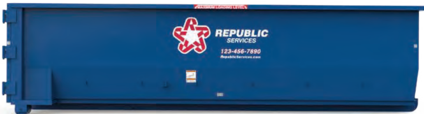
Contenedor sobre ruedas de 30-yardas (23'1" L x 8' W x 6'1" H)