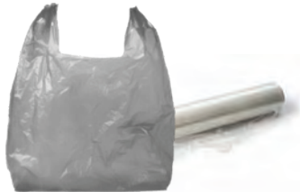
Bolsas y envoltura de plástico