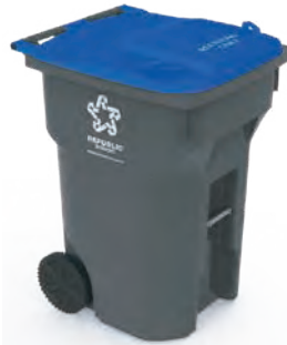
96 galones 40.7" H x 28" W x 32.1" D Cabén diez bolsas de basura de 13 galones

El tamaño estándar de los contenedores es de 96 galones . Hay contenedores más pequeños disponibles en tamaños de 35 galones y 64 galones . Las tarifas no varían por el tamaño del contenedor.