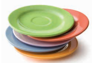
Platos y espejos