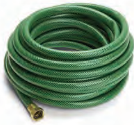
Mangueras de jardín