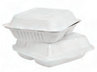
Espuma de poliestireno