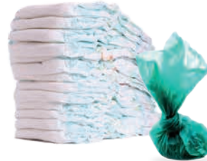
Pañales y desechos de mascotas