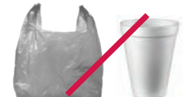
Bolsas de plástico y espuma de poliestireno