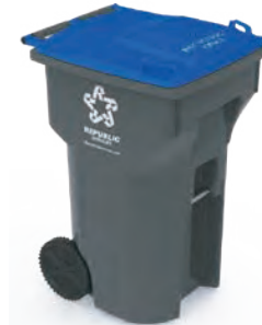
64 galones 39.1" H x 24.4" W x 27.5" D Cabén seis bolsas de basura de 13 galones