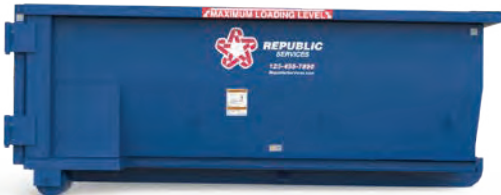
Contenedor sobre ruedas de 10-yardas (12'8" L x 8'3" W x 4'4" H)