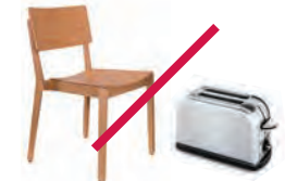
Muebles y electrodomésticos