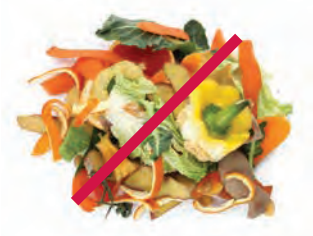
Desechos de jardín y de comida