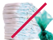
Pañales y desechos de mascotas