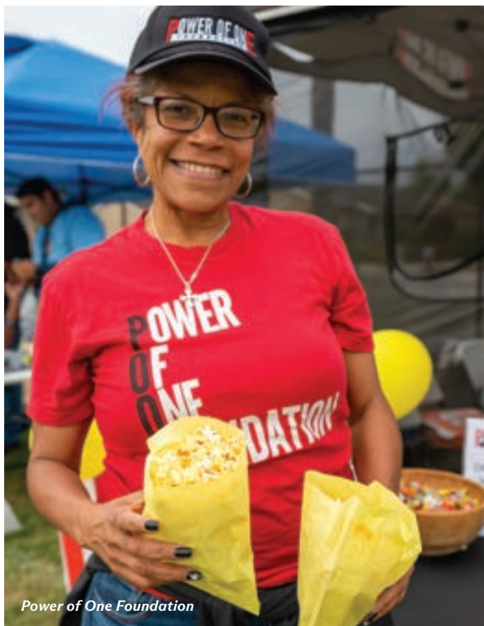
Power of One Foundation