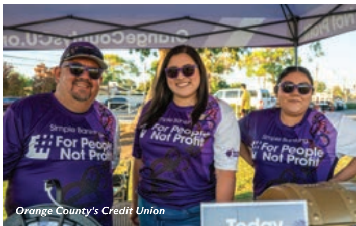
Orange County's Credit Union