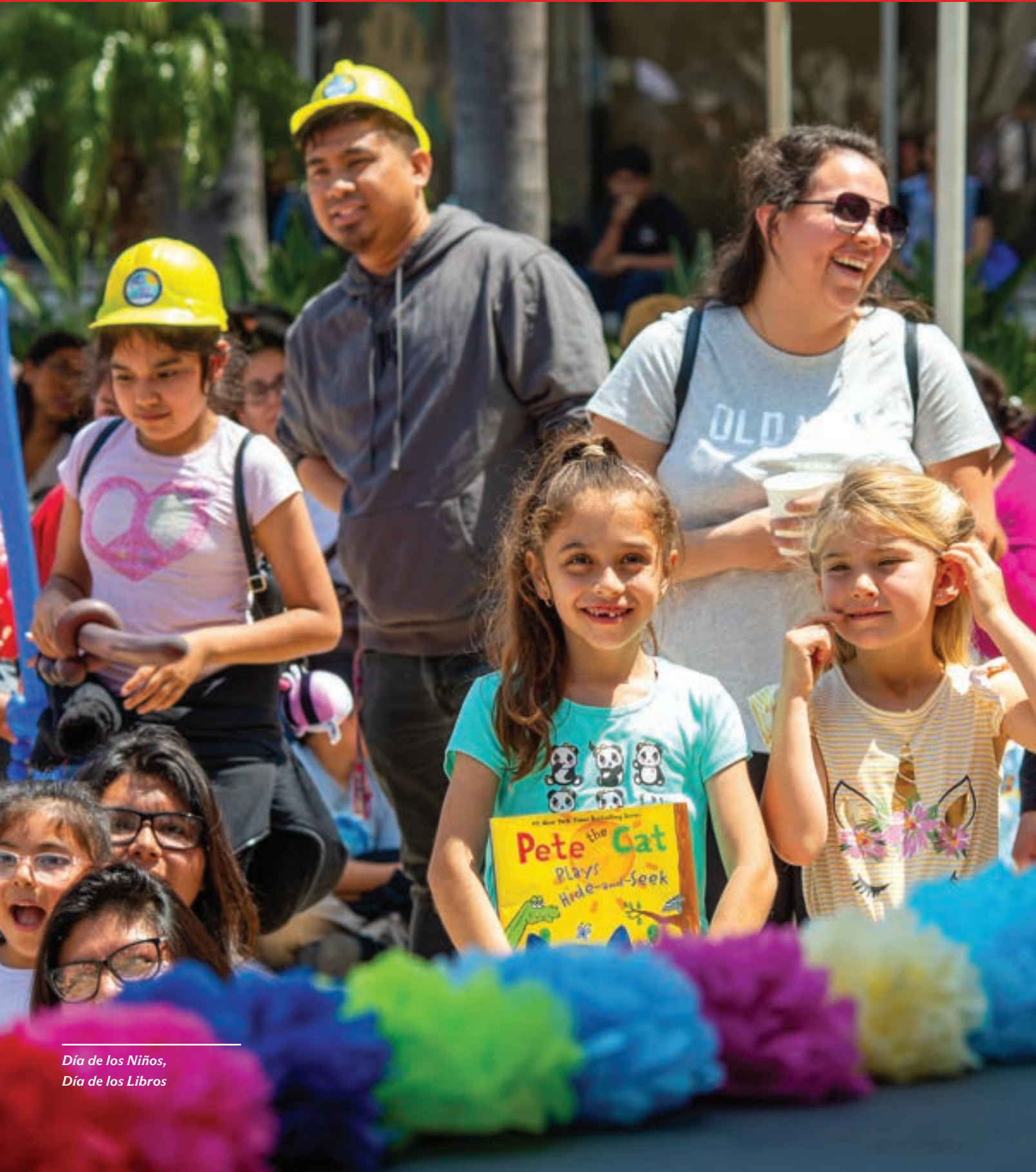
Día de los Niños, Día de los Libros