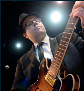
BANDA COUNTY ALL STAR