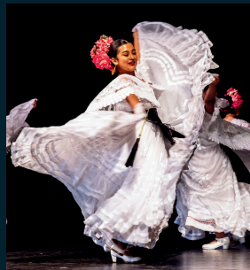
GRUPO FOLKLÓRICO QUETZALÉN