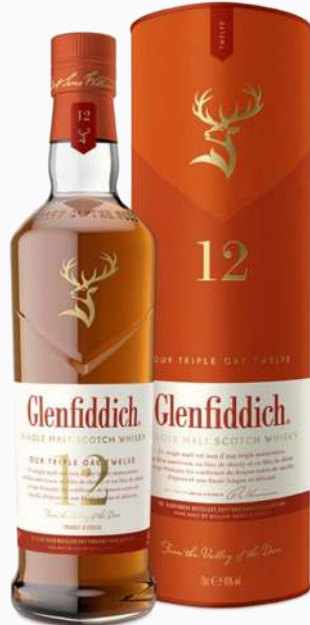
1 GLENFIDDICH 12A TRIPLE OAK 70CL 40° Ref : 23220