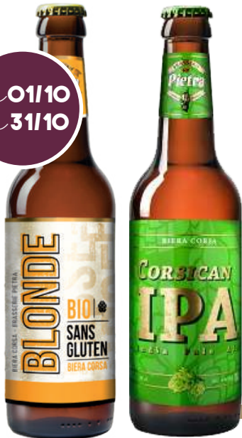
Ref: 11271 Ref: 10346