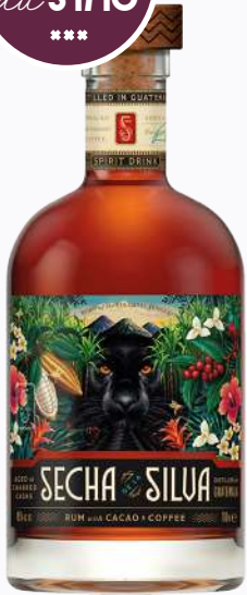
1 SECHA DE LA SILVA 70CL 40° Ref : 23218