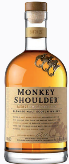
1 MONKEY SHOULDER 70CL 40° OFFERT Ref : 32278