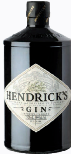
1 GIN HENDRICK'S 70CL 41.4° Ref : 32674