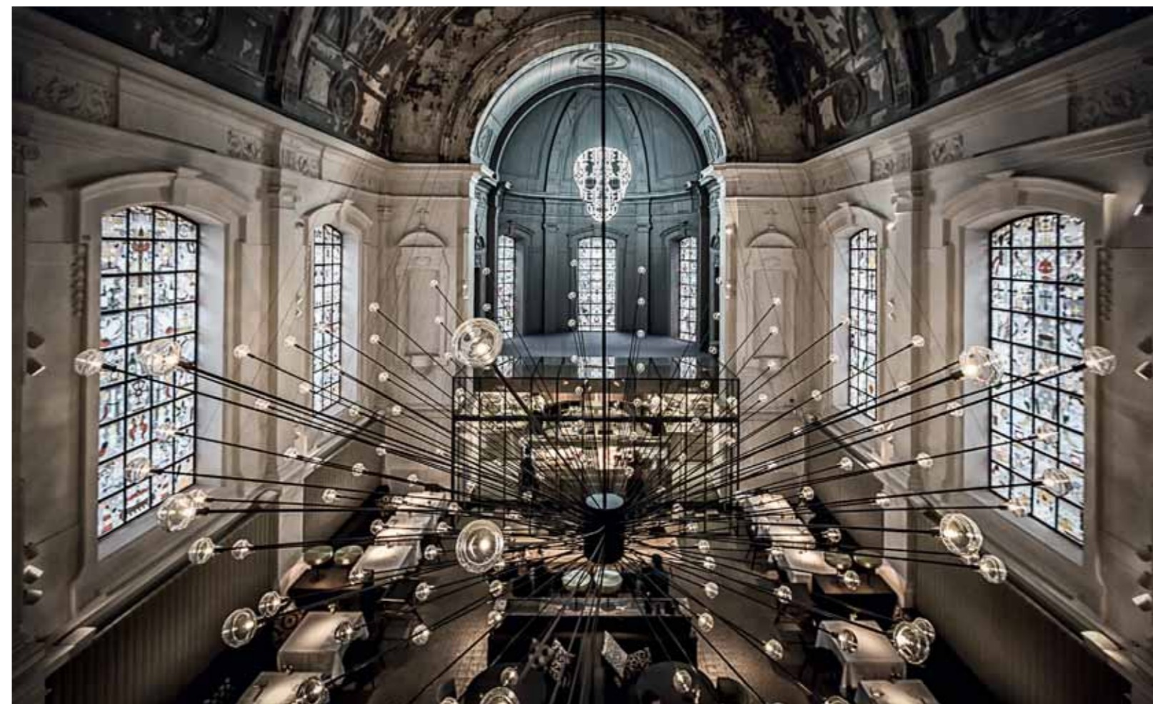
800-Kilogramm-Lichtobjekt in der ehemaligen Kapelle des Militärkrankenhauses in Antwerpen. Umbau durch das Atelier Piet Boon.