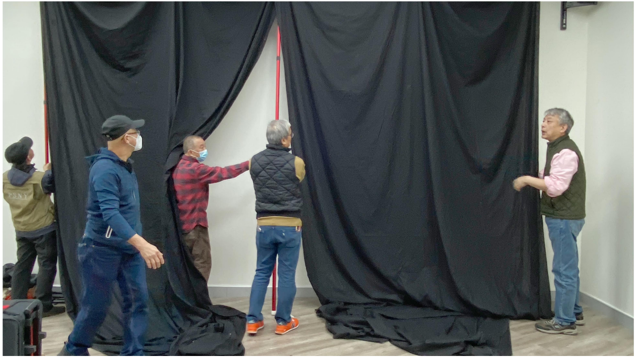
會員們搭建攝影棚。