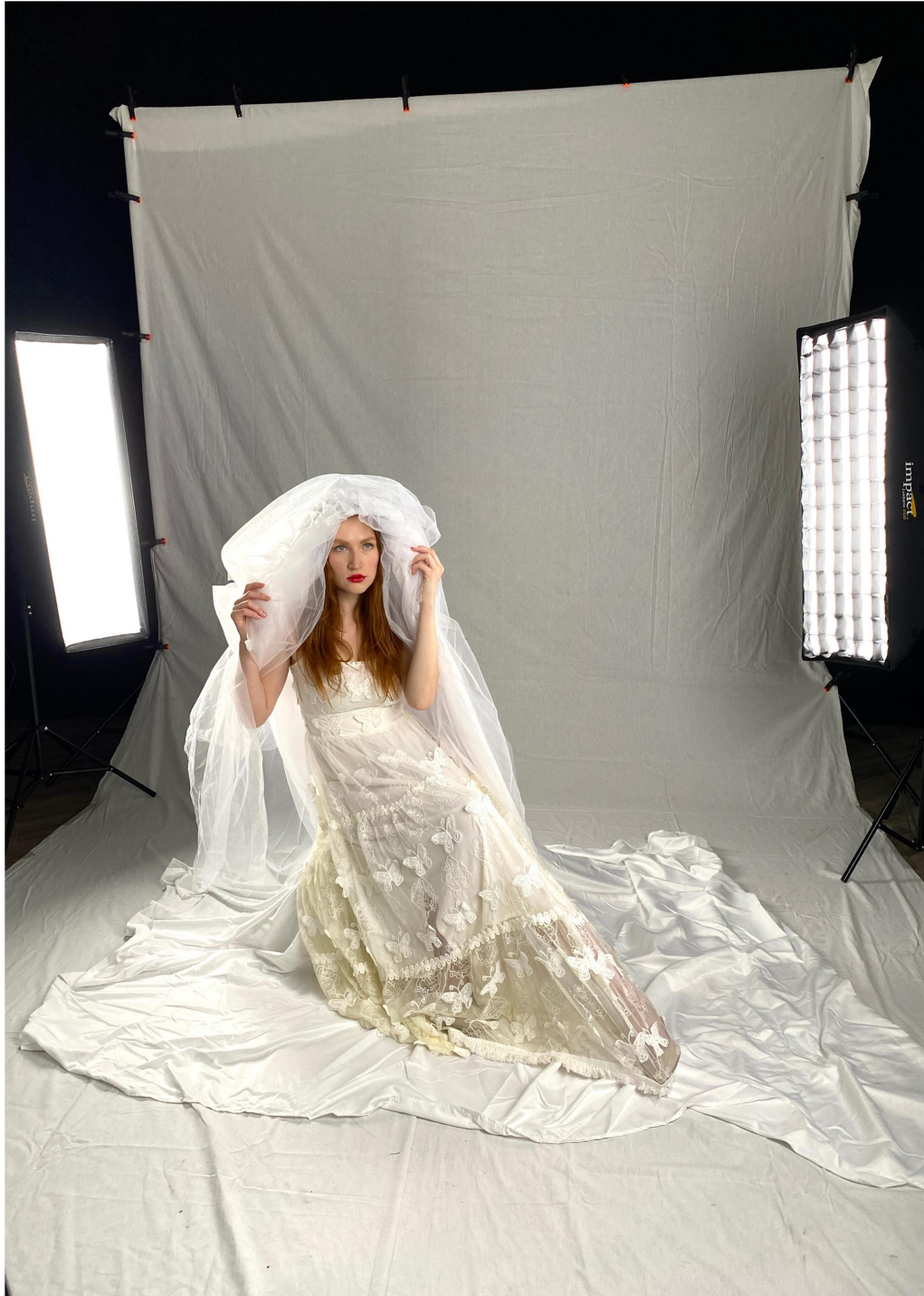
會員們辛苦搭建，從無到有的攝影棚。