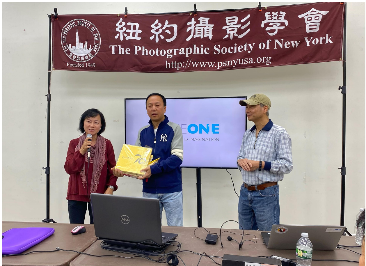
學會贈送紐約攝影學會70年攝影專輯。