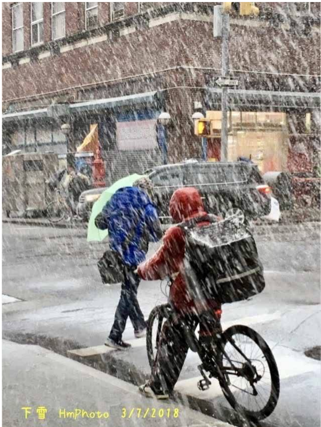
下雪 3/7/2018