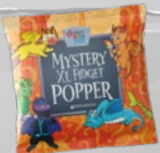
$500: Mystery XL Fidget Popper*