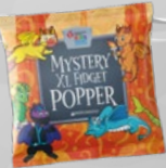
$500: Mystery XL Fidget Popper*