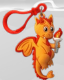
RECAUDA $5: Hearty