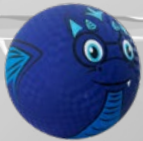
$75: Playground Ball*