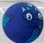
$75: Pelota Plástica*