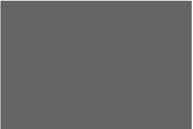
Oil residue on a beach following the BP Oil Spill