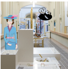
© Schatten van Vlieg in het museum van de Nationale Bank