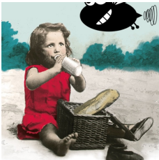
© Schatten van Vlieg @ Brussels Museum van de Molen en de Voeding!