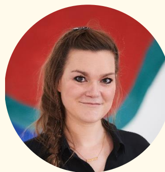
Frouke Jorna Schools & Talentontwikkeling