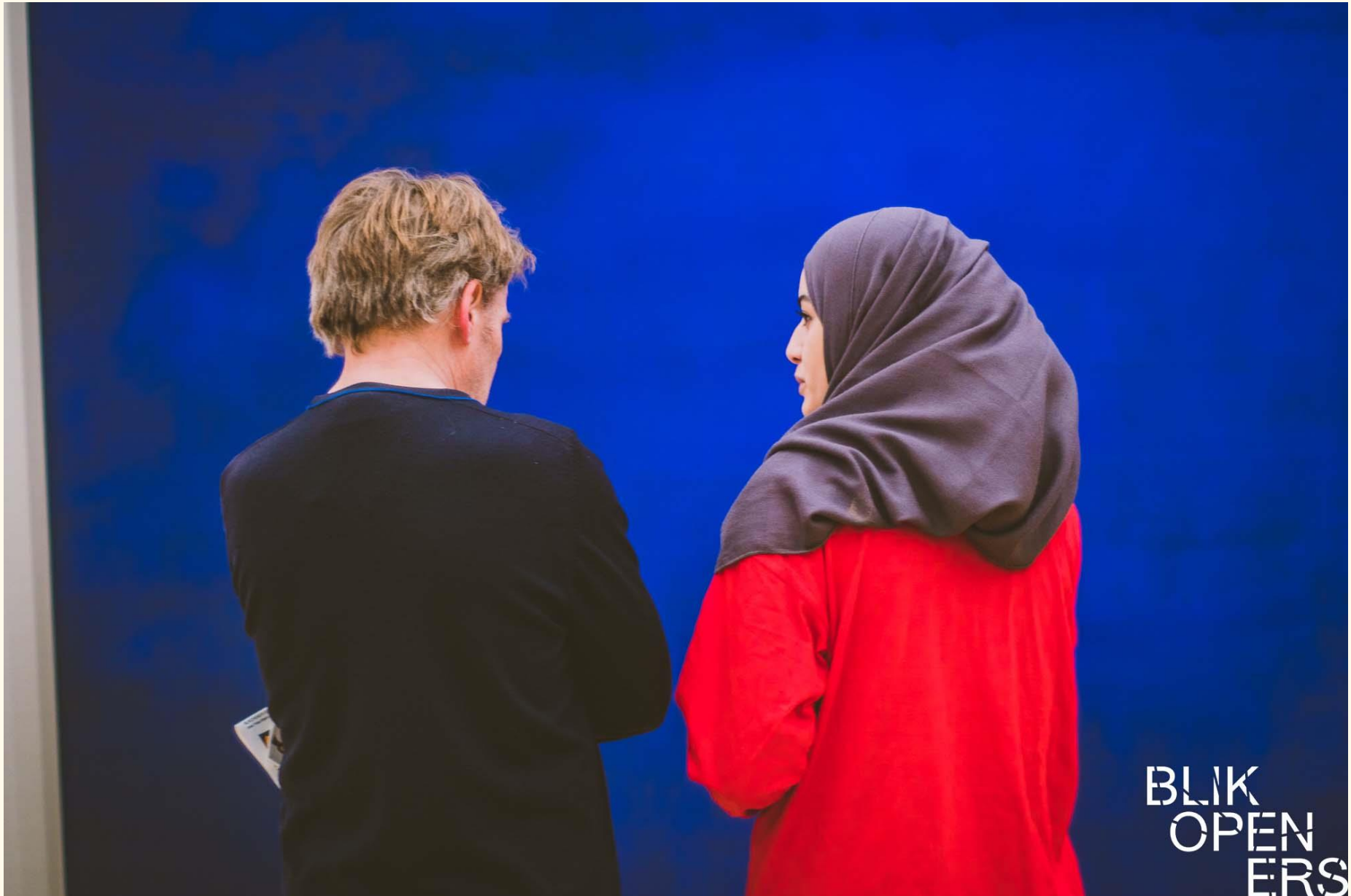
STEDELIJK MUSEUM AMSTERDAM