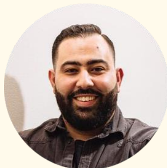
Abdel Attahiri Samen Zijn Wij Stedelijk