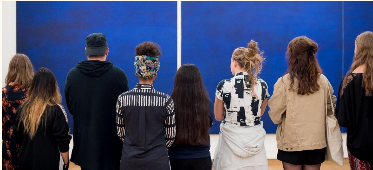
STEDELIJK MUSEUM AMSTERDAM