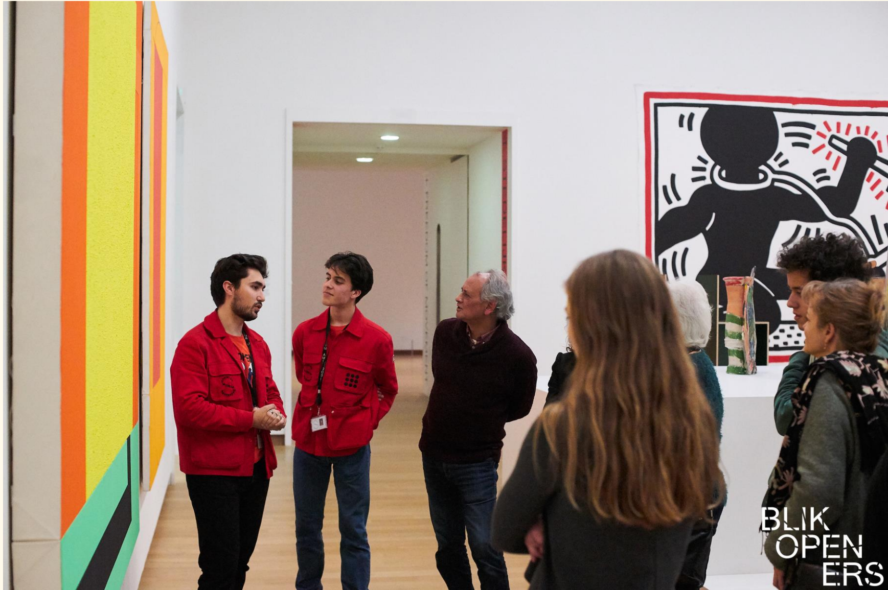
STEDELIJK MUSEUM AMSTERDAM