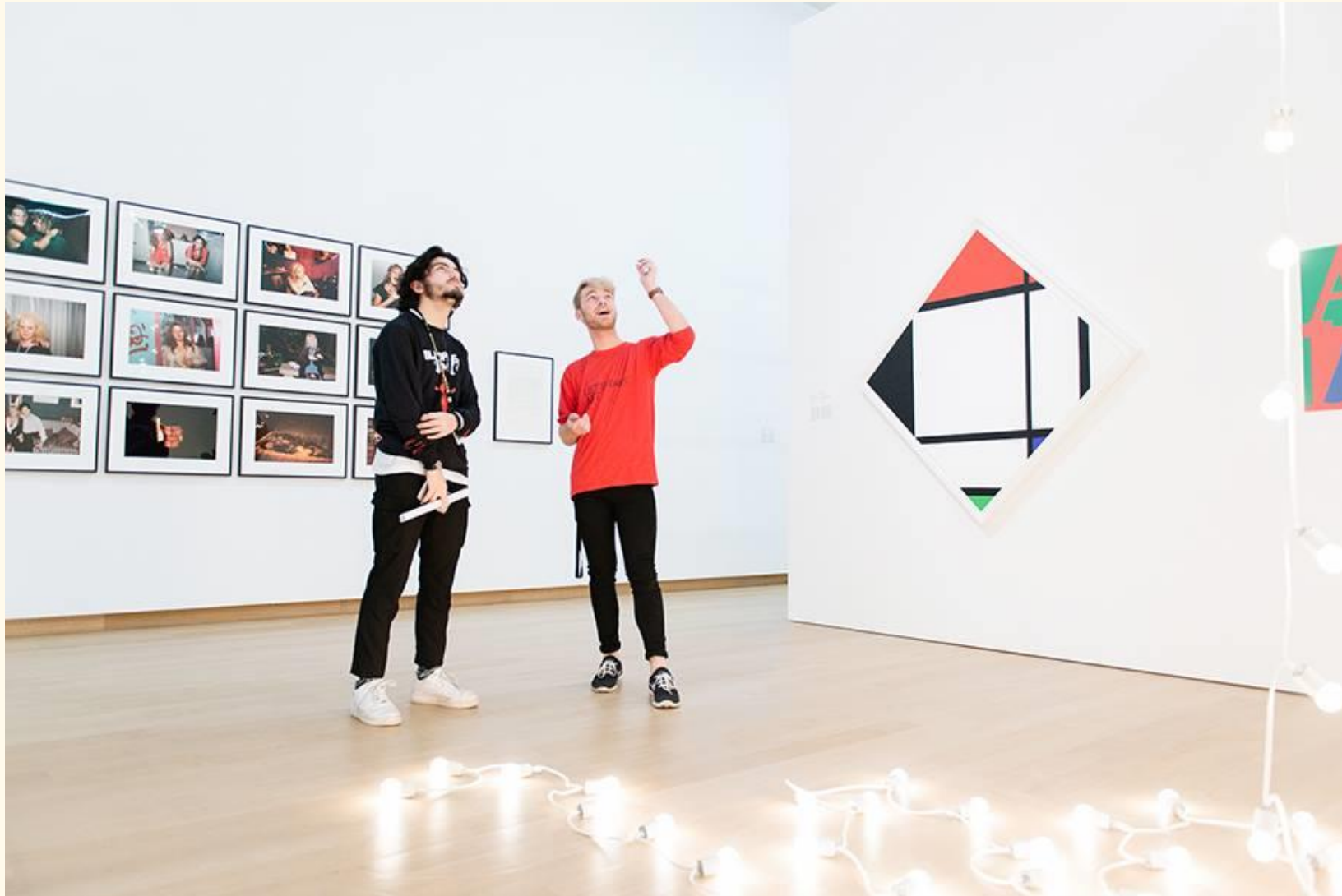
STEDELIJK MUSEUM AMSTERDAM