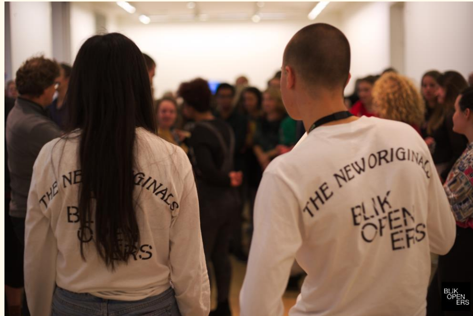
STEDELIJK MUSEUM AMSTERDAM