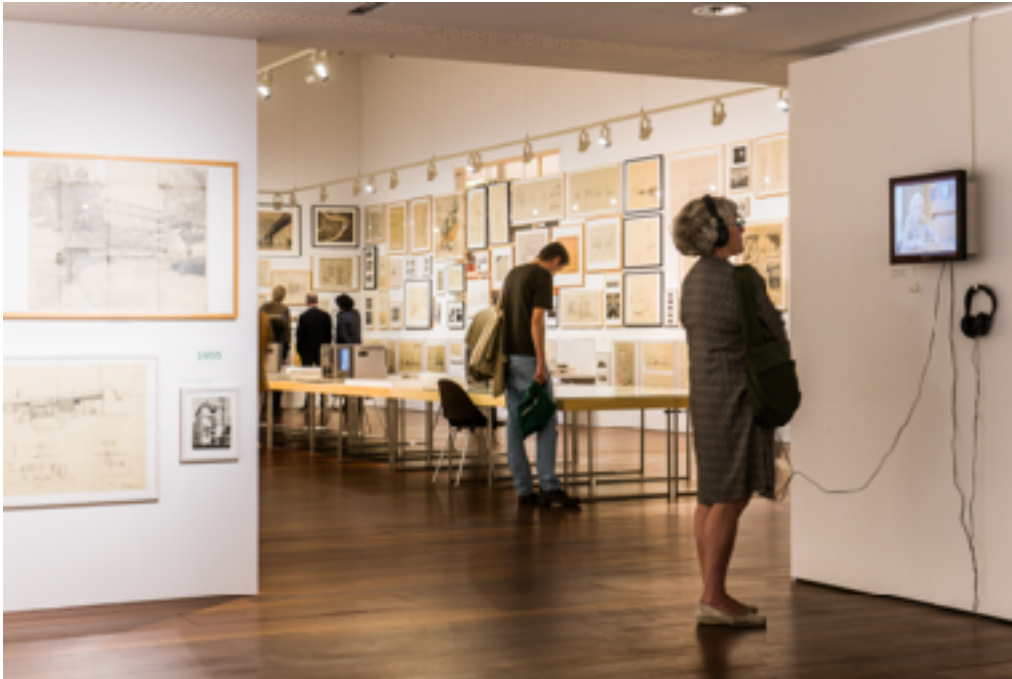
Expo Léon Stynen, Vai 2018 © Dries Luyten