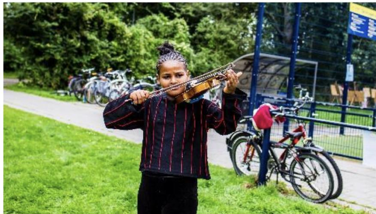
Cultuur@Cruyff Court 2021 (september)