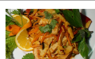
32. Măng xào ** 3 4 Vietnamesische Spezialität aus Bambussprossen mit Seitan oder Vegan Shrimp Ersatz / Vietnamese specialty made from bamboo shoots with seitan or vegan shrimp substitute

Allergene Hinweise! V allergen information!: * glutenfrei möglich / gluten-free possible * scharf *spicy , 1. Sesam , 2. Erdnüsse / peanuts, 3 Sojabohnen Erzeugnisse / soybean products 4 Glutenhaltiges Erzeugnisse / Products containing gluten .