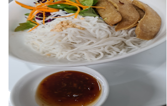
20.Bún Trộn 3 4 : Feine Reismudel mit Soja Fleischersatz und Salat in süß-würzigen Sauce / Fine rice noodles with soy meat substitute and salad in a sweet and spicy sauce