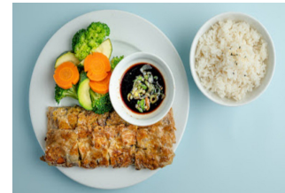
40.Chả trứng chay (vegan. Ei)* 3 4 gebratener marinierter Sojaplatten mit gegartem Gemüse Fried marinated soy platters with cooked vegetables