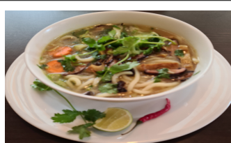
55. Udon Nudelsuppe 3 4 mit frischem Gemüse, vegan Fleisch Ersatz und Kräuter / Udon noodle soup with fresh vegetables, vegan meat substitute and herbs