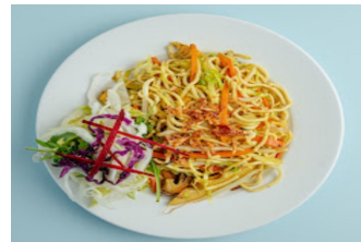
24.Mì xào 3 4 Nudel und Gemüse mit Tofu oder Seitan, gebraten Fried noodles and vegetables with tofu or seitan