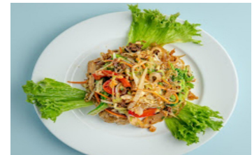
41.Miến trộn 2 3 4 Hauspezialität: Glasnudelsalat, Morchen und Gemüse mit Sate (Chili)sauce House speciality: glass noodle salad, morels and vegetables with sate (chili) sauce