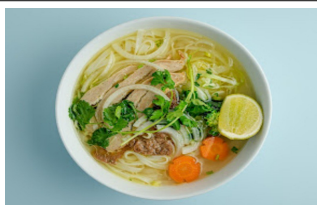
14.Phở Hà nội * 3 4 Vietnam. traditionelle , Welt bekannte Reismudelsuppe Vietnam. traditional, world- famous rice noodle soup