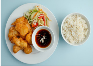
34 Tôm chay sôt gừng 3 4 Vegan Garnelen Ersatz mit Ingwer-soya -sauce, Slat Vegan shrimp substitute with ginger soy sauce, salad