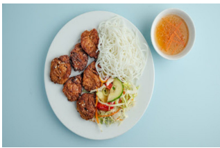
19. Bún chả Hà nội 2 3 4 Feine Reismudel mit gegrilltem Soja Fleisch Ersatz / Fine rice noodles with grilled soy meat substitute