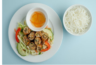
191.Bún Nem rán 2 3 4 Feine Reismudel mit vietnamesische Frühlingsrollen und Salat / Fine rice noodles with Vietnamese spring rolls and salad