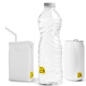
RECICLA Al contenedor Amarillo Envases de plástico, metálicos y briks