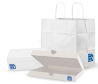
RECICLA Al contenedor Azul Envases de papel y cartón