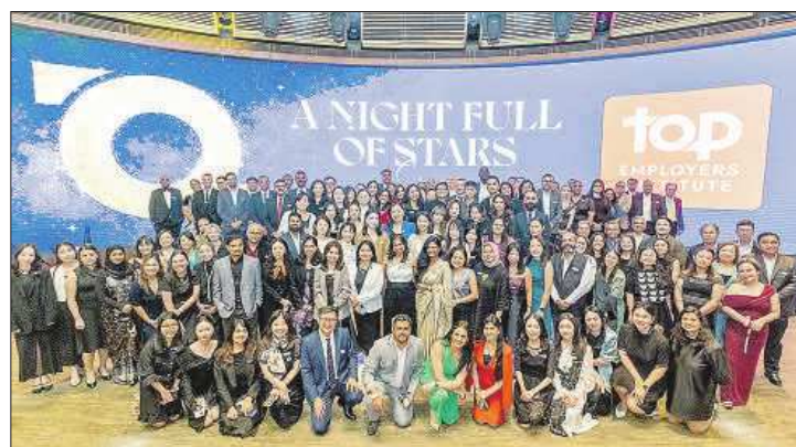
Foto de familia de las compañías Top Employers asistentes a la gala de Singapur. EE

“ Mango es una marca global de moda nacida en 1984 en Barcelona, impulsada por el diseño y la creatividad. Con presencia en más de 120 mercados y 3.000 puntos de venta, su motor son sus 17.000 personas”.