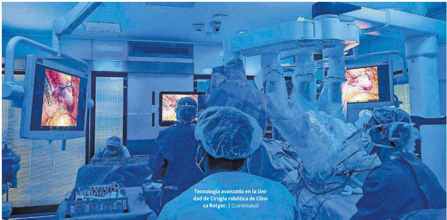
Tecnología avanzada en la Unidad de Cirugía robótica de Clínica Rotger.