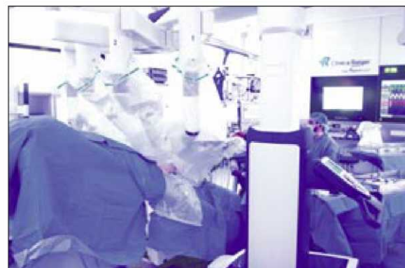
Cirugía robótica en Clínica Rotger.

► En la actualidad, y como recuerda el doctor Bauzá: "Por su seguridad y eficacia, HOLEP se considera el "gold standard" para el tratamiento quirúrgico de la hiperplasia benigna de próstatas de gran tamaño