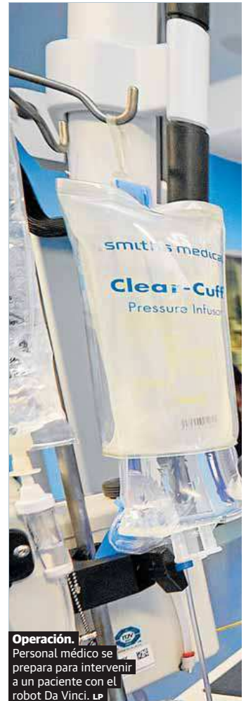
Operación. Personal médico se prepara para intervenir a un paciente con el robot Da Vinci. LP

Por eso, para que las listas no se disparen en octubre y la situación ya sea inabordable, este periodo desde ahora hasta el inicio del verano es clave para que la maquinaria quirúrgica funcione a máxima potencia. Desde la conselleria se pretende impulsar también las operaciones por las tardes.