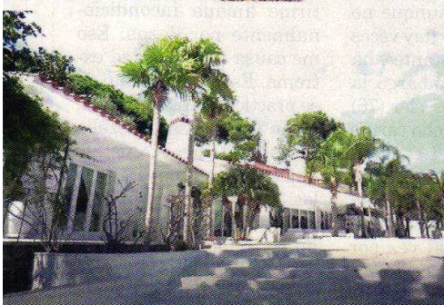
Además de tener unas privilegiadas vistas al mar Mediterráneo, en su mansión tampoco faltan el lujo y las obras de arte. Su padre fue quien compró el terreno.