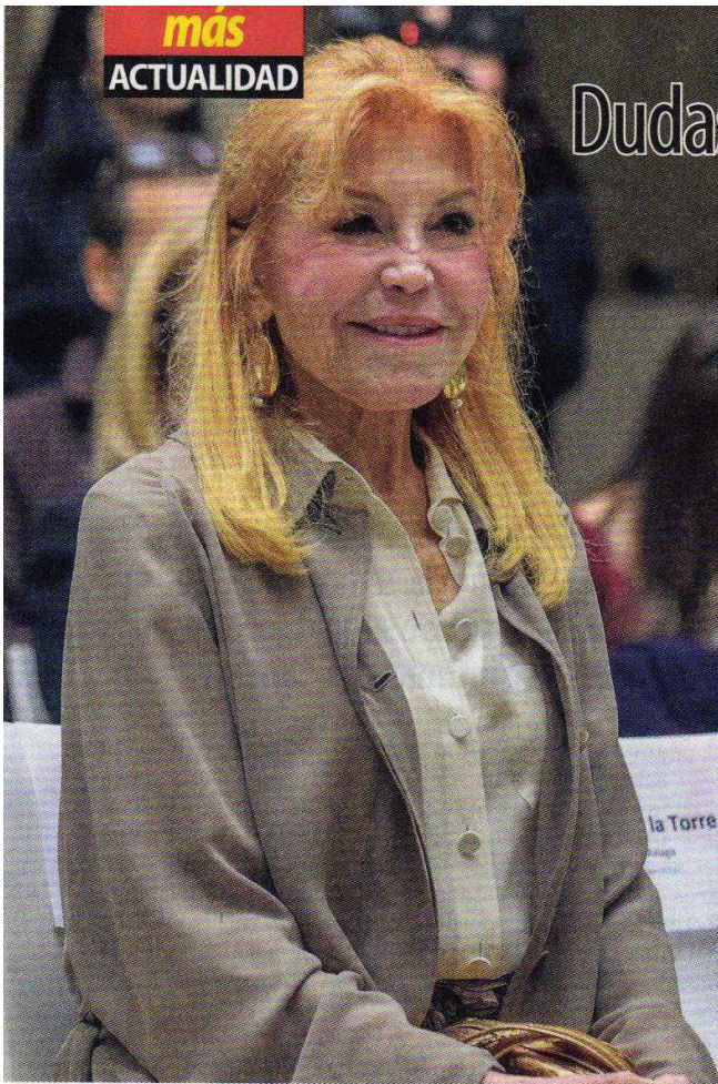
Tita está reclusa en 'Mas Mañanas', su casa favorita, que está ubicada en la costa Brava.

«Podría haber algo más. Ella es poco dada al alarmismo y a contar cosas sobre su intimidad», aseguró Gema López (53) en 'Espejo público', calificando como