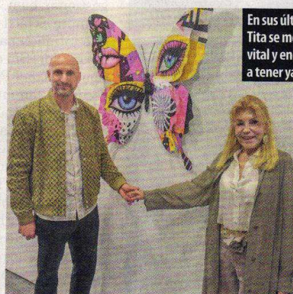
En sus últimos actos, Tita se mostró muy vital y enérgica, pese a tener ya 83 años.