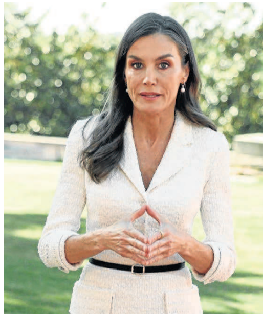
La reina Letizia, durante su intervención de ayer mediante un vídeo

Entrenas insistió en el impacto de la nicotina en el desarrollo cerebral de los adolescentes porque "el cerebro continúa desarrollándose hasta aproximada-