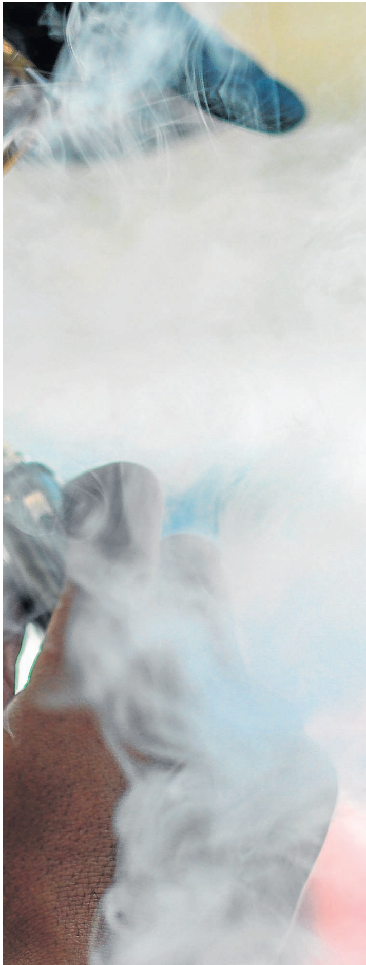
Un hombre vapea en la calle