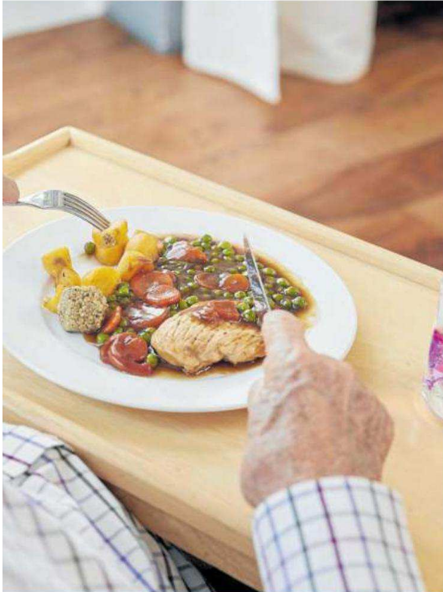
que ayuda a proteger la vía aérea durante las comidas.