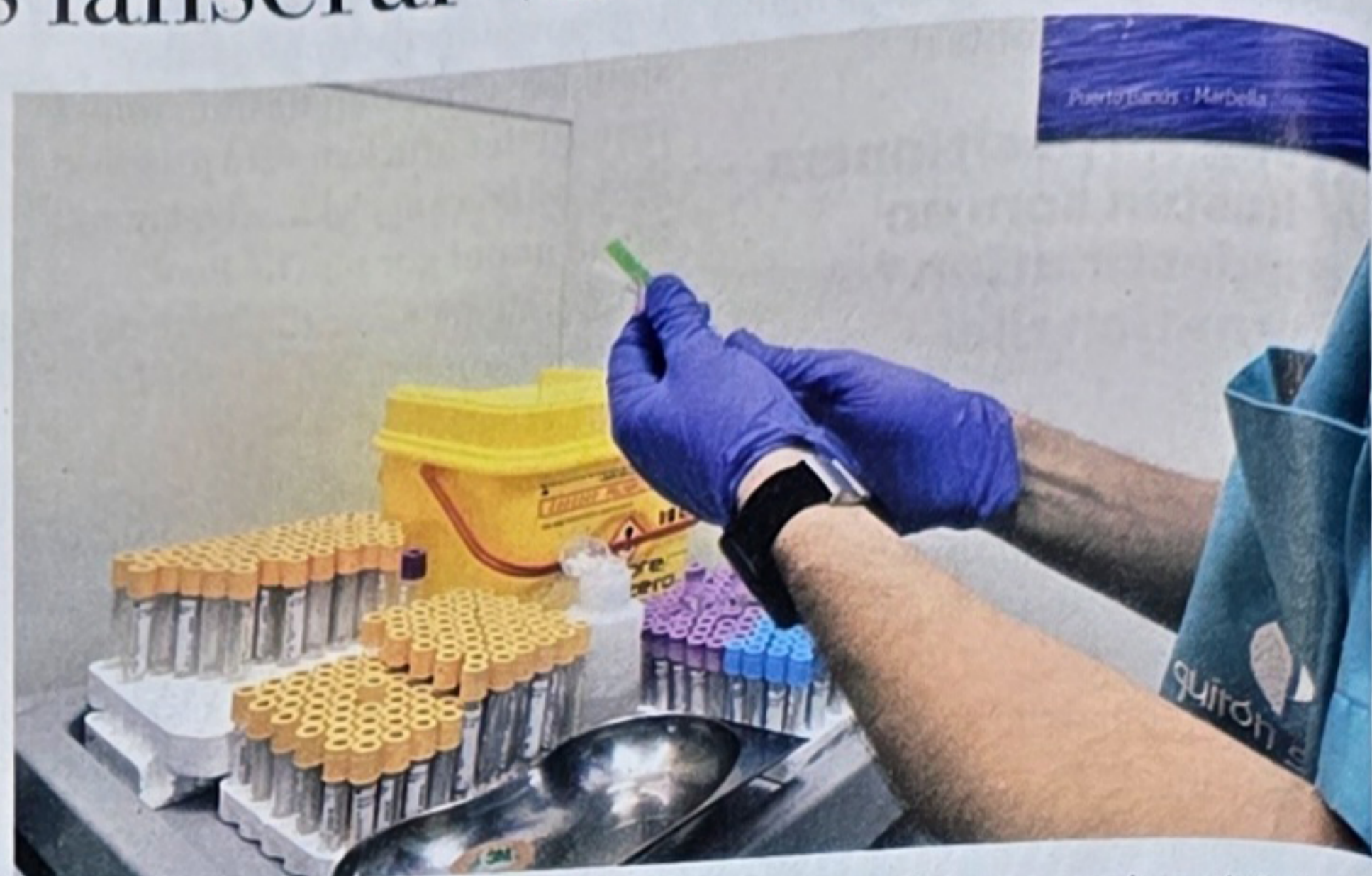
Den nya vårdmodellen i Marbella gör det möjligt att genomföra avancerade medicinska kontroller och provtagning i hemmet.