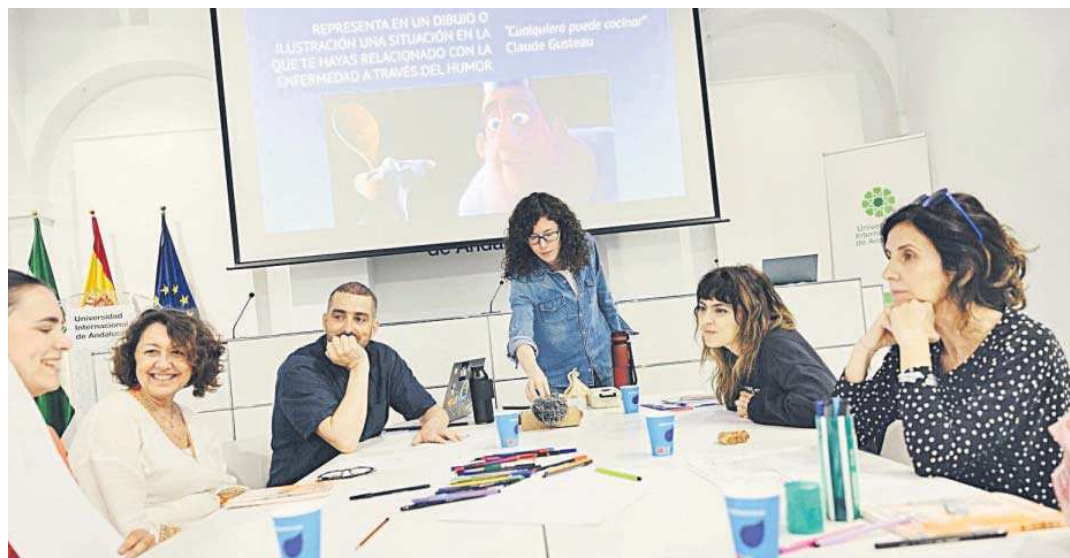
Una de las sesiones para el desarrollo del trabajo auditivo dentro de la iniciativa.