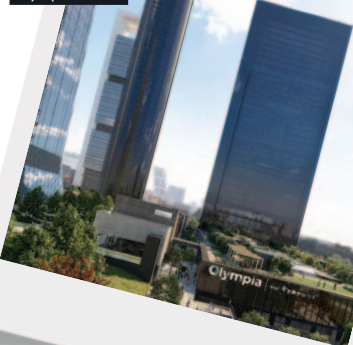
Lifestyle Center Olympia Quirón

La combinación de salud, rendimiento y estilo de vida refleja una forma de entender la medicina cada vez más alineada con las demandas actuales: preventiva, personalizada y centrada en el bienestar a largo plazo.