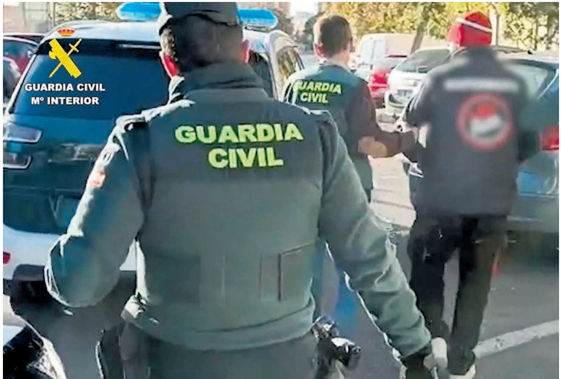
AGENTES DE LA GUARDIA CIVIL DURANTE LA DETENCIÓN EN ALICANTE DE UNO DE LOS MAYORES CIBERPREDEADORES

El Equipo de Policía Judicial de la Guardia Civil en Santa María de Guía inició el análisis de los más de 200 dispositivos de datos intervenidos, entre teléfo-