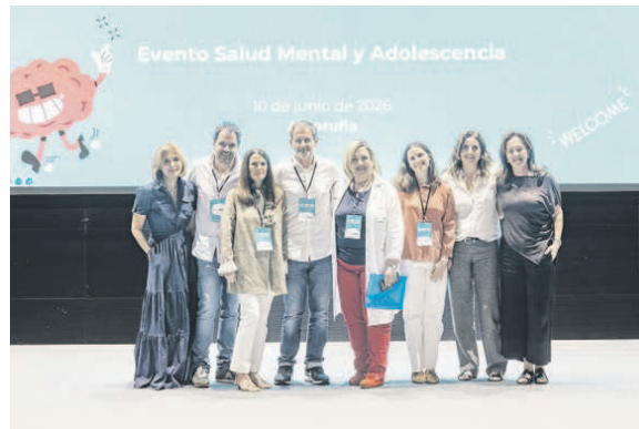
Representantes de la Fundación y el Hospital Quirónsalud A Coruña

Con estos tres centros sanitarios, el grupo Quirónsalud refuerza su presencia en la ciudad herculina y se consolida como un referente en la prestación de servicios sanitarios privados en A Coruña. ●