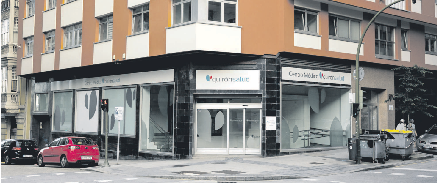
El Centro Médico Quirónsalud A Coruña, en la calle Federico Tapia